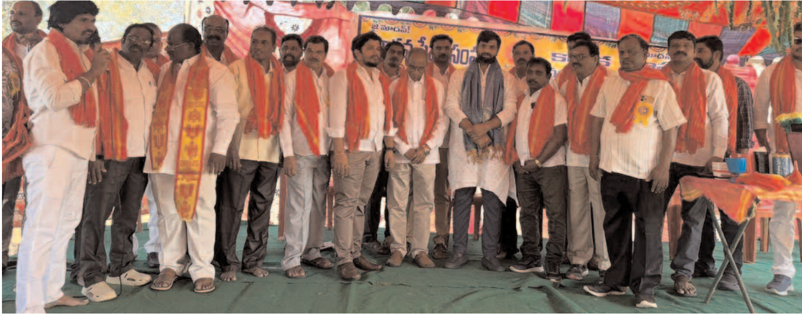
కార్తవీర్యుని పంథాను కార్యక్రమంలో పాల్గొన్న యాదవ్ సోదరులు