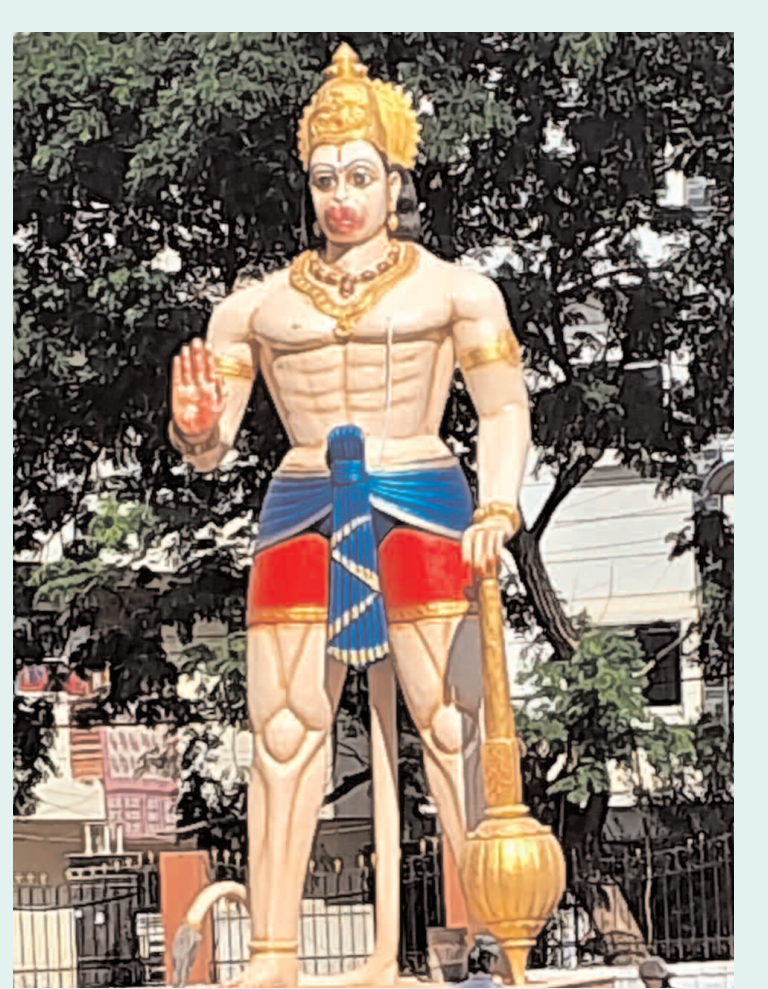
బెంపుల్ అల్వార్ లో ఆవిష్కరణకు సిద్ధమైన భారీ హనుమాన్ విగ్రహం..