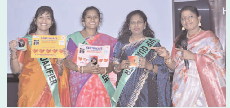
అల్వార్ లో హార్వల్ లైఫ్ లో అవార్డులను అందుకున్న నారీమణులు..