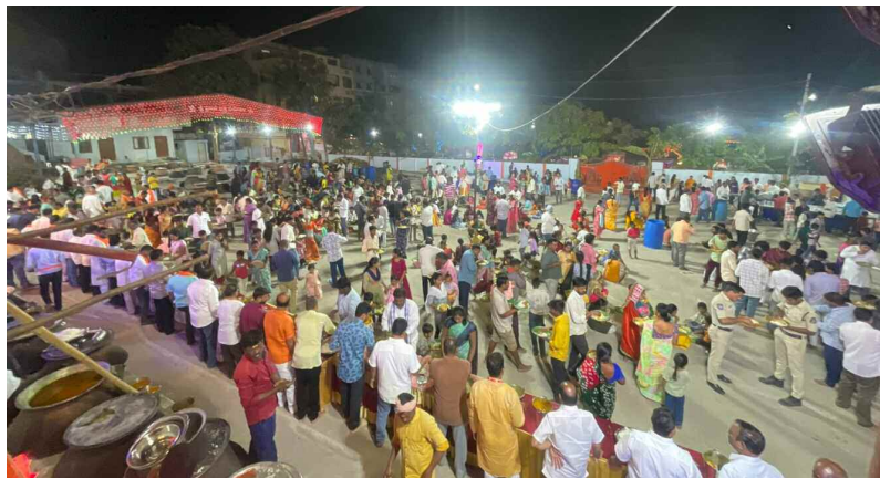
అన్నదాన కార్యక్రమంలో పాల్గొన్న భక్తులు