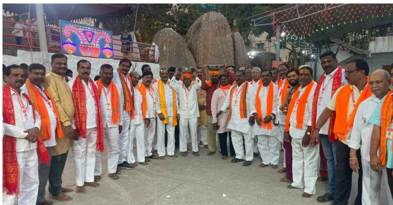
ప్రణవ భక్త సమాజం సభ్యులు