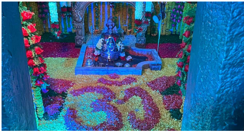
చిన్న అనంతగిరి శివాలయంలో పుష్పాలంకరణ