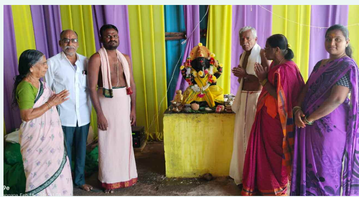
గణపతి ఆలయంలో పూజలు

దిల్లీలోని భారతమండపంలో జరుగుతున్న ఏట ఇంపాక్ట్ సమితి-2026లో పాల్గొనడానికి ప్రపంచం నలుమూలల నుంచి వచ్చిన వివిధ దేశాల ప్రభుత్వ నేతలు, కార్పొరేట్ దిగ్గజాలకు ప్రధానమంత్రి సరేంద్రమోదీ బుధవారం రాత్రి విందు ఇచ్చారు. ఈ కార్యక్రమంలో సీఎం రేవంత్ రెడ్డి పాల్గొన్నారు. ఇందుకోసం ఆయన ముంబయి నుంచి బుధవారం సాయంత్రం దిల్లీకి వచ్చారు. అంతకుముందు ఆయన మహారాష్ట్ర సీఎం దేవేంద్ర ఫడణవీస్ ఆహ్వానం మేరకు ముంబయి వెళ్లి కైమేట్ బీక్ కార్యక్రమంలో పాల్గొన్నారు.