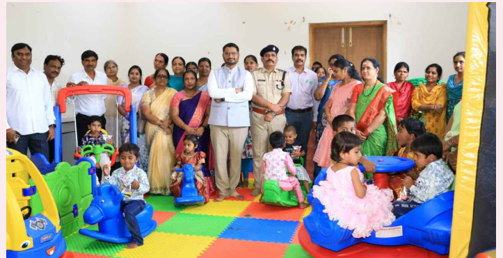
కలెక్టర్ కార్యాలయంలో శిశు సంరక్షణ కేంద్రాన్ని ప్రారంభం