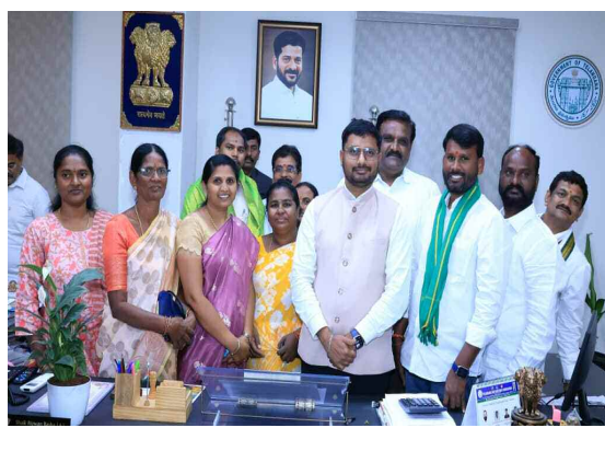
కలెక్టర్ ను కలిసిన మున్సిపల్ చైర్ పర్సన్