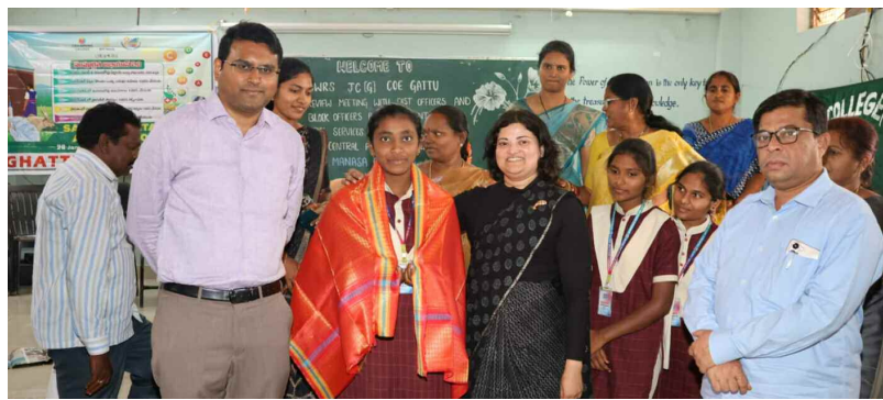
గంగాల జిల్లా ప్రతినధి, ఫిబ్రవరి 19 (నమస్తే ఉదయం)

సంపూర్ణత అభియాన్ లో నిర్దేశించిన లక్ష్యాలను వంద శాతం పూర్తి చేసేలా సంబంధిత శాఖల అధికారులు చిత్తశుద్ధితో పనిచేయాలని అభియాన్ ప్రోగ్రాం సెంట్రల్ ప్రభాల అధికారి మానస గంగోత్రి కాట అన్నారు. నీతి అయోగ్ సౌజన్యంతో నిర్వహిస్తున్న అభియాన్ ప్రోగ్రాం కు గట్టు మండలం ఎంపికైన నేపథ్యంలో గురువారం ప్రోగ్రాం సెంట్రల్ ప్రబాల అధికారి మానస గంగోత్రి కాట జిల్లా కలెక్టర్ బి. ఎం. సంతోష్ తో కలిసి గట్టు మండలంలోని సాంఘిక సంక్షేమ బాలికల గురుకుల విద్యాలయం సమావేశపు మందిరంలో పలువురు జిల్లా, ట్రాక్ అధికారులతో నిర్వహించిన సమీక్ష సమావేశంలో ప్రోగ్రామ్ సెంట్రల్ ప్రబాల అధికారి మానస గంగోత్రి కాట మాట్లాడుతూ ప్రోగ్రాంలో భాగంగా సంపూర్ణత అభియాన్ 2.0 కార్యక్రమం జనవరి 28న ప్రారంభించడం జరిగిందని వివరించి 14 వరకు కొనసాగుతుందన్నారు. పాఠశాలల్లో, అంగన్ వాడీ కేంద్రాల్లో పూర్తిస్థాయిలో మౌలిక వసతులు కల్పించడమే కాక ప్రోగ్రామ్ లక్ష్యాలను పూర్తిస్థాయిలో సాధించేలా ముందుకెళ్లాలన్నారు. అక్షరాస్యతపరంగా వెనుకబడ్డ గట్టు మండలంలో విద్యార్థులందరికీ ప్రగతి సాధించడమే కాక మిగిలిన అన్ని రంగాల్లో పురోగతి సాధించడమే అభియాన్ లో ట్రాక్ ప్రోగ్రామ్ ప్రధాన ఉద్దేశం అన్నారు. కేంద్ర ప్రభుత్వం అందించే వివిధ రూపాలను ఇక్కడి ప్రజలు సర్వసాధారణం చేసుకొని ఆర్థికంగా అభివృద్ధి సాధించేలా సంబంధిత శాఖల అధికారుల కృషి చేయాలన్నారు. అభియాన్ లో ట్రాక్ ప్రోగ్రాం విజయవంతం చేసేందుకు మరో సమావేశం నిర్వహించేనాటికి 100%