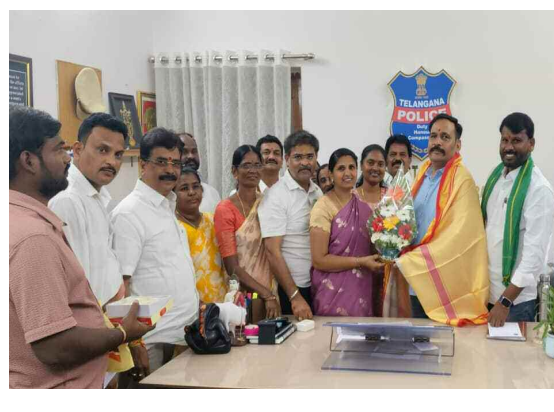
డి.సి.పి.ను కలిసిన మున్సిపల్ చైర్ పర్సన్