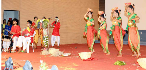
సాంస్కృతిక కార్యక్రమాల నిర్వహించిన విద్యార్థులు