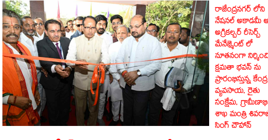
రాజేంద్రనగర్ లోని నేషనల్ అకాడమి ఆఫ్ అగ్రికల్చరల్ రిసెర్చ్, మేనేజ్మెంట్ లో సాహిత్యం నిర్వహించిన క్లమీతా భవన్ ను ప్రారంభిస్తున్న కేంద్ర వ్యవసాయ, రైతు శాఖ మంత్రి శివరాజ్ సింగ్ చౌహాన్