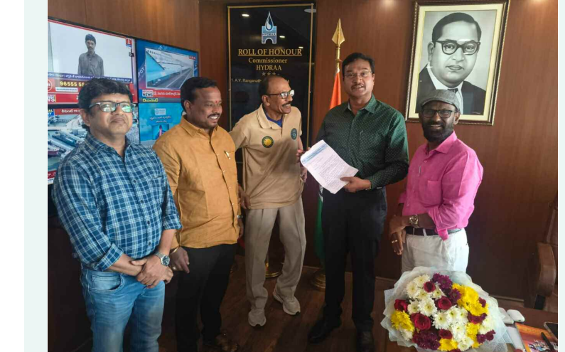
హైద్రా కమిషనర్ రంగనాథ్ కు మినీ వత్రం అందజేస్తున్న సీనియర్ జడ్పీల్స్, సామాజికవేత్త మ్యూషమ్ మధు