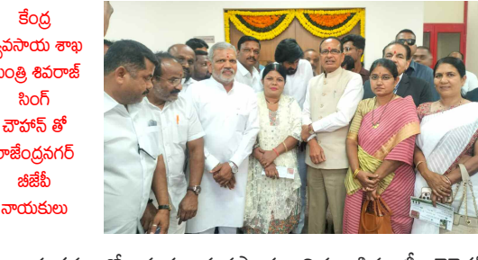
కేంద్ర వ్యవసాయ శాఖ మంత్రి శివరాజ్ సింగ్ చౌహాన్ తో రాజేంద్రనగర్ జిజీపీ నాయకులు

బుద్వేల్, ఫిబ్రవరి 21 (నమస్తే ఉదయం) నూనె గింజలు, చిరు ధాన్యాలలో రైతులకు లాభదాయకతను పెంచడానికి శాస్త్రవేత్తలు కృషి చేయాలని కేంద్ర వ్యవసాయ, రైతు సంక్షేమ, గ్రామీణాభివృద్ధి శాఖ మంత్రి శివరాజ్ సింగ్ చౌహాన్ అన్నారు. రాజేంద్రనగర్ లోని నేషనల్ అకాడమి ఆఫ్ అగ్రికల్చరల్ రిసెర్చ్ మేనేజ్మెంట్ (నార్మల్) స్వల్పోత్సవ సంవత్సరం సందర్భంగా ఆ సంస్థ ఆవరణలో నిర్వహించిన క్లమీతా భవన్ ను శనివారం ఆయన భారత వ్యవసాయ పరిశోధన మండలి డైరెక్టర్ జనరల్ డాక్టర్