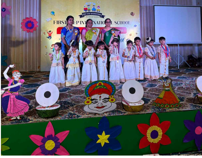
చిన్నారులకు మెడల్స్ బహుకరణకు ముఖ్య అతిథులు