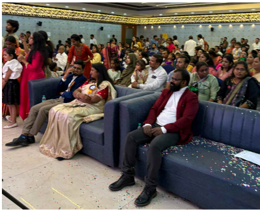
విద్యార్థుల తల్లి తండ్రులు, అతిథులు