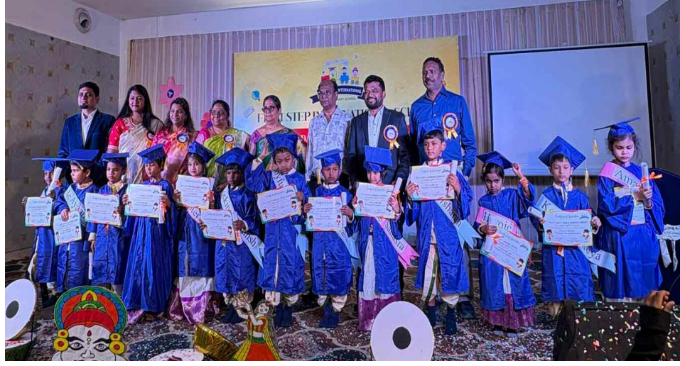
పీ పీ 2 పూర్తి చేసిన విద్యార్థులకు గ్రాడ్యుయేషన్ సెర్టిఫికేట్ లు అందచేసిన పాఠశాల యాజమాన్యం