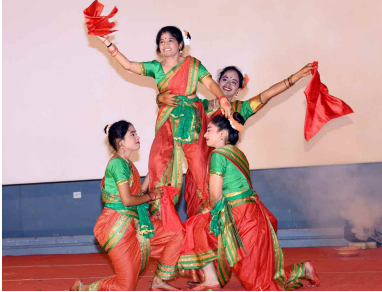
సాంస్కృతిక కార్యక్రమాల నిర్వహించిన విద్యార్థులు