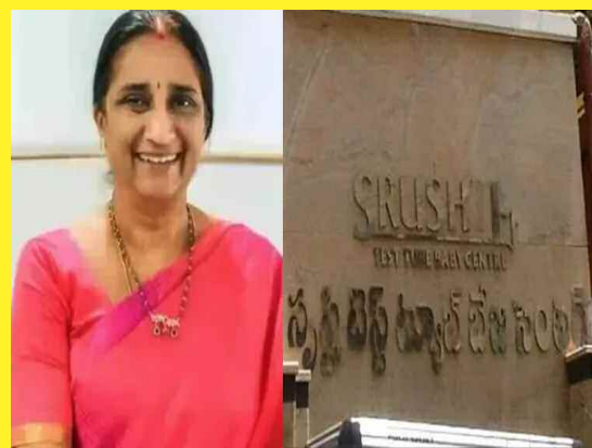
హైదరాబాద్, ఫిబ్రవరి 23 (నమస్తే ఉదయం):

సృష్టి కేసులో డాక్టర్ నమ్రతను రెండు రోజుల పాటు ఈడీ కస్టడికి న్యాయస్థానం అనుమతించింది.