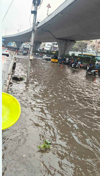
ఉష్ణం పట్టి బిల్డర్ నెంబర్ 190 వద్ద