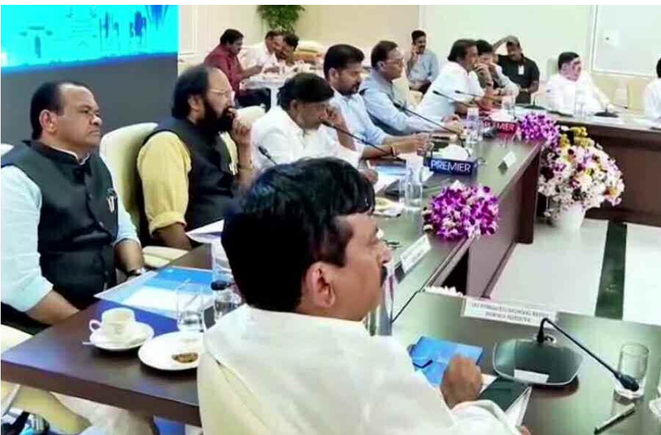
హైదరాబాద్, ఫిబ్రవరి 23 (నమస్తే ఉదయం):

60 ఏళ్లలోపు ప్రభుత్వ ఉద్యోగులు మరణిస్తే రూ.10 లక్షలు