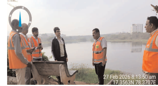
పీఠం చెరువు వద్ద...

మకరండు సూచించారు. జోనల్ కమిషనర్ గా బాధ్యతలు స్వీకరించాక మొదటిసారిగా ఆయన బండ్లగూడ, పీఠం చెరువు ప్రాంతాలలో అధికారులతో కలిసి పర్యవేక్షించారు. రోడ్ల పక్కన చెత్త ఉండకూడదా చూడాలన్నారు. మార్కెట్ ప్రాంతాలలో ఎప్పుడూ శుభ్రంగా ఉండేలా జాగ్రత్తలు తీసుకోవాలన్నారు. చెరువులు, పారుదల వద్ద కూడా