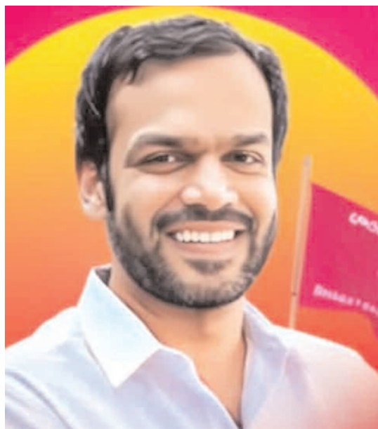
యువ కిషోరం పట్టణ కార్మిక రెడ్డి