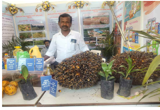
ఆయిల్ ఫామ్ స్టాల్