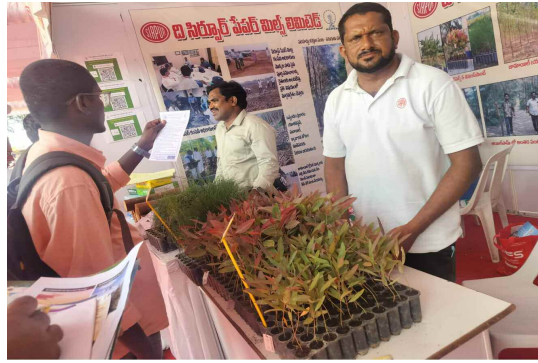
యూకారిప్టస్ మొక్కల సాగు కోసం అవగాహన కల్పించే స్టాల్