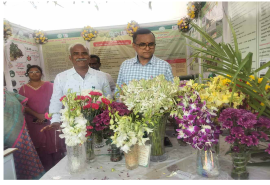
ఉడ్డాస్ శాఖ స్టాల్