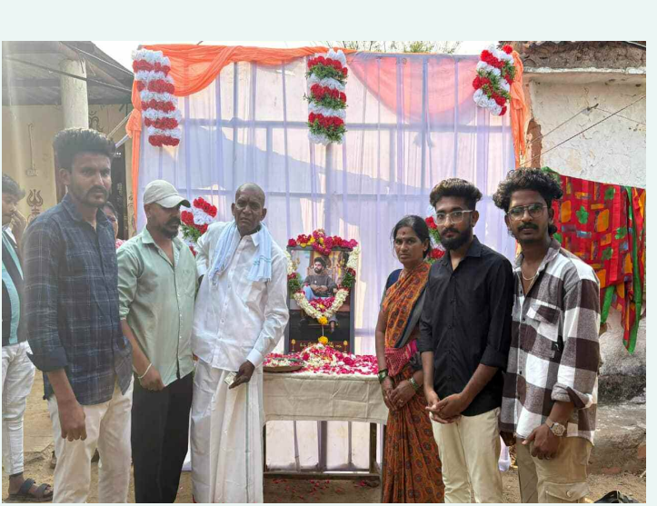
చిత్రహానికి నివాళులు అందిస్తున్న స్నేహితులు

నిర్మించుకున్న కొందరిని ఇబ్బంది పెట్టే ఉంటామని.. వారందరికీ డబుల్ డెడ్ రూంలు ఇవ్వడానికి సిద్ధంగా ఉన్నానని ప్రకటించారు. చెరువులు కట్టాకు గురైతే వరదలు వస్తే ఇంట్లోకి వచ్చి మన వస్తువులు మొత్తం మునిగిపోతాయని వివరించారు. చెరువులను ఆక్రమించిన వాళ్ళు సహకరించాలని కోరుతున్నానని తెలిపారు. ఇలాంటి ప్రదేశాల్లో మహిళలకు స్వయం సహాయక స్థాల్లో ఏర్పాటు చేయమని చెప్పానని గుర్తు చేశారు. చిన్న పిల్లలకు ఆట స్థలం కోసం కూడా ఈ పార్కులు పనిచేస్తాయన్నారు. ఇక్కడ ఇంతకు ముందు కోరినట్లు షటిల్ కోర్టు నిర్మాణానికి అవసరమైన చర్యలు తీసుకోవాలని అధికారులు అదేశించారు. నాలలకు రక్షణగా గోడలు కట్టాలన్నారు. ఢిల్లీలో పార్లమెంట్ కు సెలవులు ప్రకటించే పరిస్థితి పోల్యూషన్ వల్ల వచ్చిందని గుర్తు చేశారు. ముందు చూపు లేక ఢిల్లీకి ఆ పరిస్థితి వచ్చిందన్నారు. బొంబాయిలో వర్షం కురిస్తే ఇంట్లోంచి బయటకు రాలేని పరిస్థితి ఏర్పడిందన్నారు. అలాంటి పరిస్థితి హైదరాబాద్ కి రావద్దంటే మూసి ప్రక్షాళన చేయాల్సిందేనని కుండబద్దలు కొట్టారు. మూసి ప్రక్షాళన వద్దంటే అది హైదరాబాద్ పూర్వరీను అడ్డుకున్నట్టేనని పేర్కొన్నారు. నిధులు ఇచ్చేందుకు తాను సిద్ధంగా ఉన్నానని.. మంచి అధికారులను మీకు ఇచ్చానని తెలిపారు. పని చేయించుకోవడం మీ వంతు అంటూ