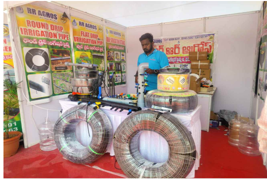
సూక్ష్మ జంతు సేద్యం కు కావలసిన పరికరాలు