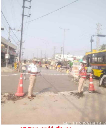
వర్షి వయపు వద్ద సీసీ రోడ్డు పనులు