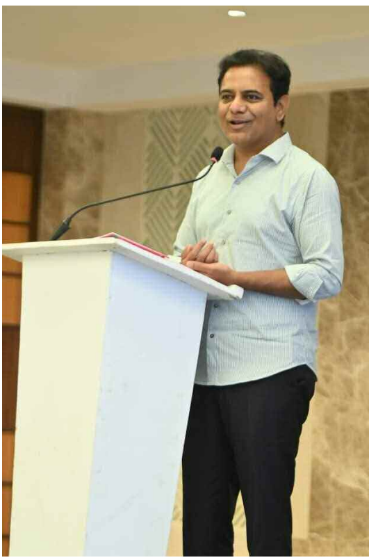
ఏ కమిటీలను వేయడం లేదు. పబ్లిక్ ఆకౌంట్స్ కమిటీని మా పార్టీ నుంచి ద్రోహం చేసి పోయిన వ్యక్తికి ఇచ్చారు. ఒక్క సెలెక్ట్ కమిటీ లేదు, స్టాండింగ్ కమిటీ లేదు, పీఠీసెన్స్ కమిటీ

రాహుల్ గాంధీతో సహా ఆరు గ్యారంటీలకు చట్టబద్ధత ఇస్తామని చెప్పిన కాంగ్రెస్ మోసాన్ని కూడా ఈ బిల్లు ద్వారా శాసనసభలో ఎండగడతామన్నారు. కాంగ్రెస్ పార్టీ సభ్యులు కూడా ఈ బిల్లుకు మద్దతు ఇచ్చి తమ చిత్తుకొట్టిని నిరూపించుకోవాలని కేటీఆర్ పిలుపునిచ్చారు. కాంగ్రెస్ పార్టీ హామీల అమలు, వైఫల్యాన్ని మోసాన్ని ఎండగట్టేందుకు ఈ బిల్లు సమావేశాల్లో అనుసరించాల్సిన పూర్వం పైన మంగళవారం సమావేశాన్ని ఏర్పాటు చేసుకున్నాం. కాంగ్రెస్ పార్టీ ఇచ్చిన హామీలు, కాంగ్రెస్ పార్టీ చేస్తున్న అరాచకాల పైన ఈ అసెంబ్లీ సమావేశంలో అనుసరించాల్సిన పూర్వం పైన చర్చించామని కేటీఆర్ తెలిపారు. మా పార్టీ సీనియర్ నేతలు మధుసూదనాచారి, బండ ప్రకాష్, తలసాని శ్రీనివాస్ యాదవ్, సబితా రెడ్డి తదితరులు మాట్లాడారు. ఈ ప్రభుత్వం అధికారంలోకి వచ్చి రెండు సంవత్సరాలు దాటిగా అసెంబ్లీలో