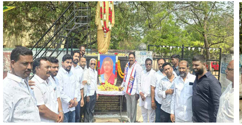
సావిత్రీ బాయి పూలే చిత్ర పటానికి నివాళులు అర్పిస్తున్న ఎమ్మెల్యే డి ప్రకాష్ గౌడ్.