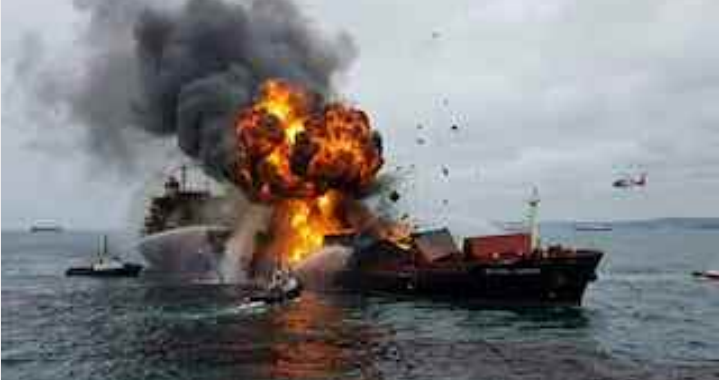
టెహ్రాన్, మార్చి 11 (నమస్తే ఉదయం)

చమురు రవాణాకు అత్యంత కీలకమైన హార్కుజ్ జలసంధి సమావంత్ భీకర దాడులు జరిగాయి. ఈ జలసంధి సమావంత్ ఇరాన్ మోహరించిన మైన్ లేయర్స్, నౌకలు లక్ష్యంగా అమెరికా దళాలు విరుచుకుపడ్డాయి. దీంతో అవి ధ్వంసమయ్యాయి. తాము జరిపిన దాడుల్లో ఇరాన్ కు చెందిన 16 మైన్ లేయర్స్ తో పాటు పలు నౌకలు ధ్వంసం అయ్యాయని యూఎస్ సెంట్రల్ కమాండ్ పేర్కొంది. ఈ దాడికి సంబంధించిన వీడియోను ఎక్స్ పోస్టు చేసింది. జలసంధిలో పేలుడు సృష్టించడానికి ఇరాన్ సన్నాహాలు చేస్తున్నట్లు అమెరికా నిఘా వర్గాలకు సమాచారం అందిందని ఆ దేశ మీడియా పేర్కొంది. ఈ నేపథ్యంలో అమెరికా అధ్యక్షుడు ట్రంప్ ఇరాన్ కు గట్టి హెచ్చరికలు చేశారు. జలసంధి సమావంత్ ఇరాన్ ఎక్కడైనా మైన్స్ ను అమర్చినట్లయితే.. వాటిని తక్షణమే తొలగించాలని ట్రాత్ సోషల్ లో పేర్కొన్నారు. లేదంటే పర్యవసానాలు చాలా తీవ్రంగా.. మునుపెన్నడూ చూడని స్థాయిలో ఉంటాయని హెచ్చరించారు. ఇరాన్ స్వయంగా వాటిని తీసేస్తే.. అది మంచి పరిణామం