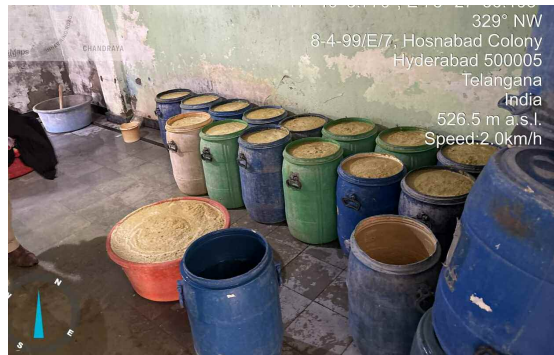
329° NW 8-4-99/E/7- Hosnabad Colony Hyderabad 500005 Telangana India 526.5 m a.s.l. Speed:2.0km/h