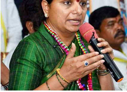
హైదరాబాద్, మార్చి 11 (నమస్తే ఉదయం)

కష్టకాలంలో బీఆర్ఎస్ సోషల్ మీడియా అండగా నిలవలేదని ఆవేదన జైలు జీవితం తనను జగమొండిగా మార్చేసిందన్న జాగృతి అధ్యక్షురాలు