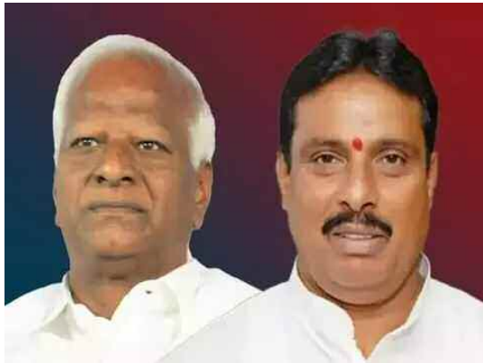
దూరంగా ఉన్నాం. ప్రజాస్వామ్య చరిత్రలో చీకటి రోజు : ఎమ్మెల్యేల అనర్హత పిటిషన్లపై స్పీకర్ తీర్పువెలుపరించిన సేవభ్యంలో