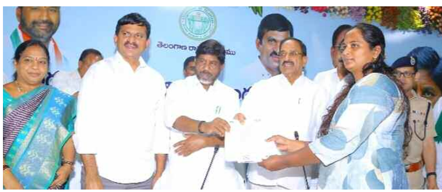
ఖమ్మం, మార్చి 11 (నమస్తే ఉదయం)

సీఎం రేవంత్ రెడ్డి చేతుల మీదుగా ఇందిరమ్మ ఇళ్ల గృహప్రవేశం నాలుగున్నర లక్షల ఇళ్ల నిర్మాణానికి 22,500 కోట్లు వెలుగుమట్ల బాధితులకు ఇళ్ల పట్టాలు పంపిణీ చేసిన భట్టి