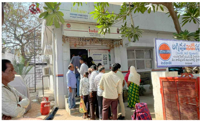
వింతల పేజీ అగ్నిద్రుళ్ల ఇండియన్ గ్యాస్ ఏజెన్సీ వద్ద క్యూ కట్టిన వినియోగదారులు