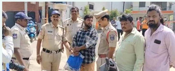
శివరాంపల్లి సమీపంలో గంజాయి కలిగి ఉన్న వ్యక్తిని అరెస్ట్ చేసి పోలీసులు