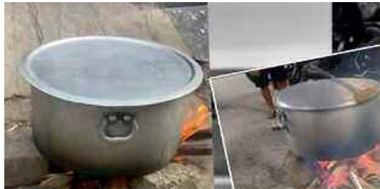
జయశంకర్ దౌత్యంతో కొంత ఊరట

హర్రూజ్ సి.గె.. పేదవాడి పొయ్యి ఆరక తప్పదా? ఖమేనీ హెచ్చరికలు - తెలంగాణ హస్తక్షేత్ర గ్యాస్ కష్టాలు!