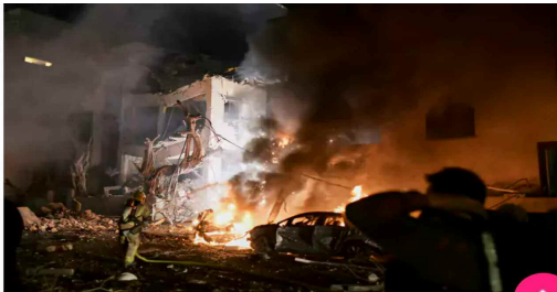
ఇరాన్ దాడి అనంతరం ఓ భవనంలో మంటలను ఆర్పుతున్న సిబ్బంది..