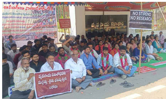
స్టైఫెండ్ పెంచాలంటూ నిరసన వ్యక్తం చేస్తున్న వ్యవసాయ విశ్వవిద్యాలయం విద్యార్థులకు మద్దతు ప్రకటిస్తున్న తెలంగాణ సామాజిక విద్యాస్థి సంఘం అధ్యక్షుడు