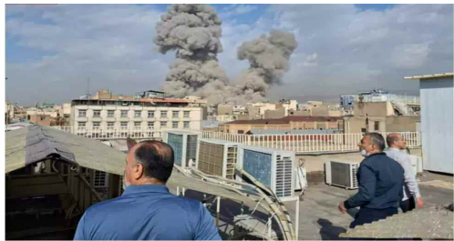
అమెరికా, ఇజ్రాయేల్ క్లిష్టత దాడి అనంతరం టెహ్రాన్ లో అలముకున్న పాగ