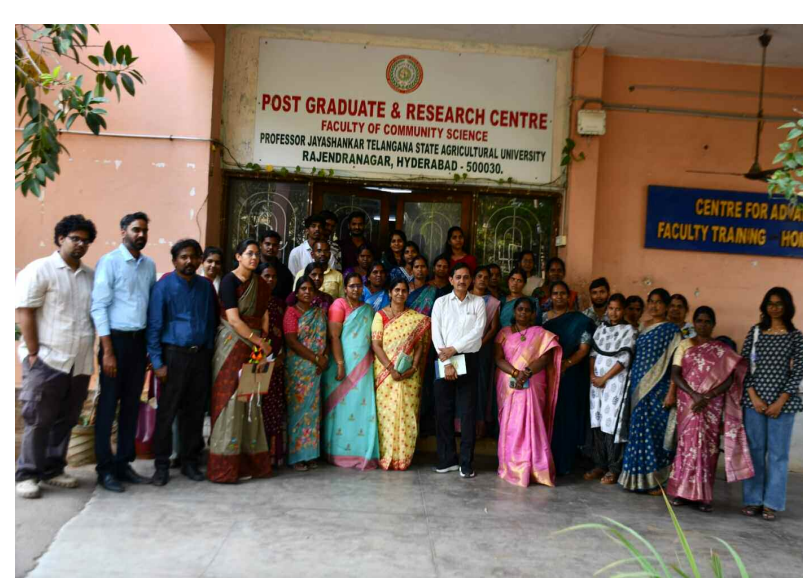
శిక్షణ లో పాల్గొన్న గ్రామీణ రైతులు