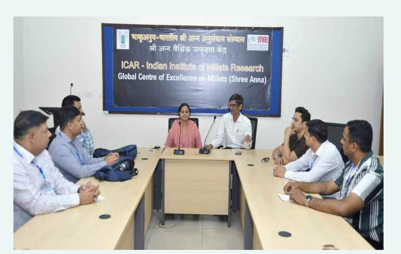
రాజేంద్రనగర్ లోని బి ఐ ఎ ఆర్ ను సందర్శించిన బి ఐ ఎ ఆర్ అధికార భాష విభాగం అసిస్టెంట్ డైరెక్టర్ లు