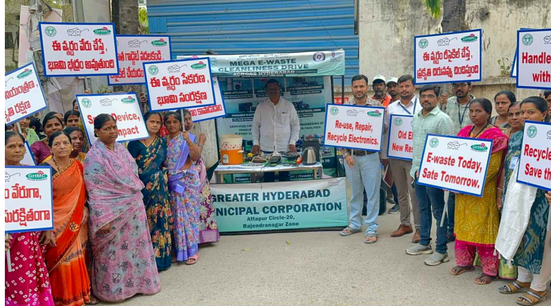
ఈ వేస్ట్ కలెక్షన్ సెంటర్