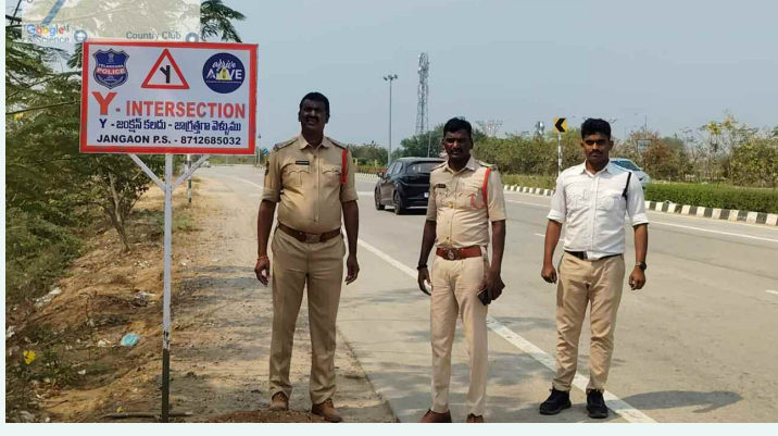
ట్రాఫిక్ పోస్టల్ లోడ్స్ ను పెడుతున్న పోలీసు లు