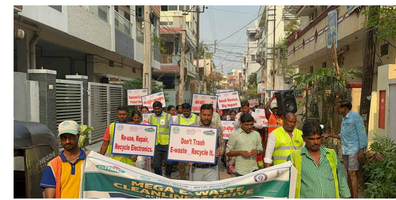
బాదా కాలనీ లో ఈ వేస్ట్ సేకరణ కోసం ర్యాబీ నిర్వహిస్తున్న అత్యాచార సర్కిల్ డిప్యూటీ కమిషనర్ వి సమ్మయ్య