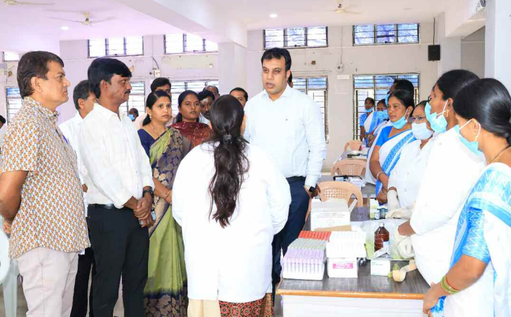
సవ్ నెంబర్ ను తనిఖీ చేస్తున్న జిల్లా కలెక్టర్