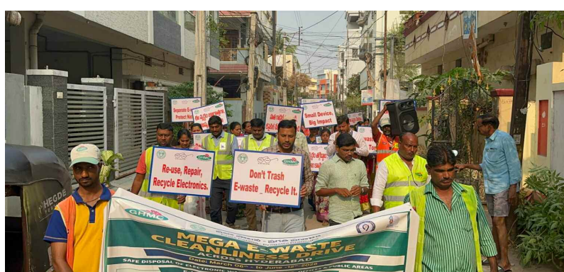
హుదా కాలనీ లో ఈ వేస్ట్ సేకరణ కోసం ర్యాలీ నిర్వహిస్తున్న అత్యాచార సర్కిల్ డివిజన్ కమిషనర్ వి సమ్మయ్య

పిల్లలు బావుల వద్ద ఆడుకోవడం లేదా ఈత కొట్టడం సమయంలో అత్యంత జాగ్రత్తగా ఉండాలని, బావుల వద్ద జారిపడే ప్రమాదం కూడా ఉంటుందని పోలీసులు తెలిపారు. ఈత బాగా రాకపోయినా సరదాగా నీళ్లలోకి దిగడం వల్ల ప్రమాదాలు సంభవించే అవకాశాలు ఉన్నాయని చెప్పారు. అందువల్ల పిల్లలు ఎప్పుడూ ఒంటరిగా బావులకు వెళ్లకుండా పెద్దల పర్యవేక్షణలోనే ఈత కొట్టాలని సూచించారు. అలాగే పిల్లలు బావులకు వెళ్లే ముందు ఇంట్లో పెద్దలకు తెలియజేయాలని, తల్లిదండ్రులు కూడా తమ పిల్లలు ఎక్కడికి వెళ్తున్నారో తెలుసుకొని జాగ్రత్తలు తీసుకోవాలని పోలీసులు పేర్కొన్నారు. పిల్లలు నీళ్లలో ఉన్న సమయంలో పెద్దలు అప్రమత్తంగా ఉంటే ప్రమాదాలను ముందుగానే గుర్తించి నివారించవచ్చని తెలిపారు. ప్రాణం విలువ ఎంతో గొప్పదని, చిన్నపాటి నిర్లక్ష్యం కూడా పెద్ద ప్రమాదాలకు దారితీస్తుందని ఈ సందర్భంగా చిన్నారులకు పోలీసులు వివరించారు. గ్రామాల్లోని బావుల వద్ద భద్రతా నియమాలు పాటించడం ద్వారా ప్రమాదాలను నివారించవచ్చని, ప్రతి ఒక్కరూ అప్రమత్తంగా ఉండాలని మల్లకల్ పోలీసులు సూచించారు. ఈ కార్యక్రమం ద్వారా చిన్నారుల్లో భద్రతపై అవగాహన పెంపొందించడమే లక్ష్యమని తెలిపారు.