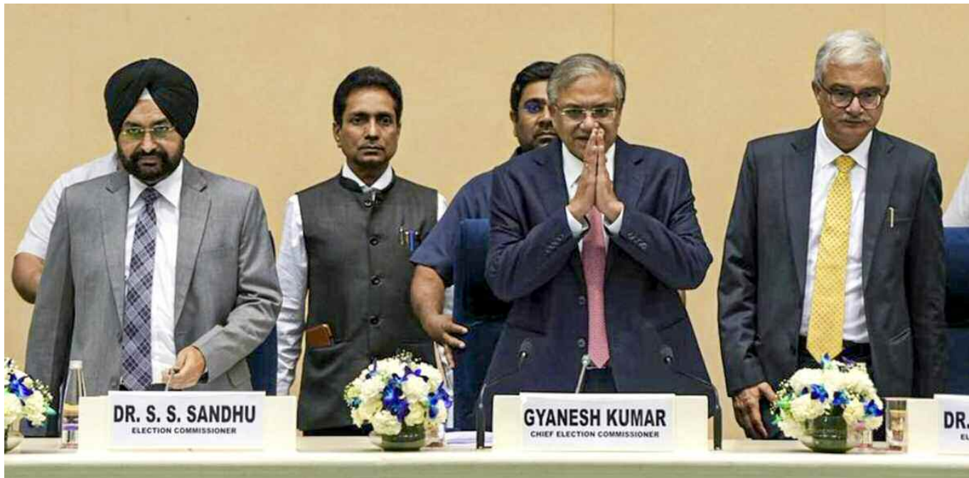
న్యూఢిల్లీ, మార్చి 15 (ప్రభాత ఉదయం):

బంగాల్, కేరళ, తమిళనాడు, అసోం, పుదుచ్చేరి అసెంబ్లీ ఎన్నికల తేదీలను ప్రకటించిన ఈసే