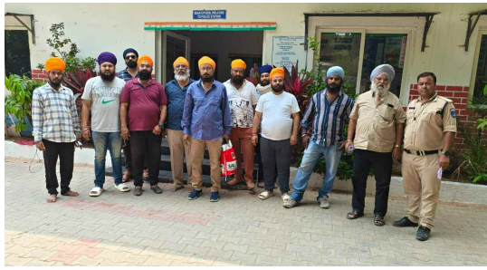
పోలీసుల ఆదుపులో భూ ఆక్రమణ దారులు