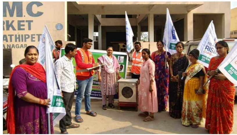
రాజేంద్రనగర్, మార్చి 15 (ప్రభాత ఉదయం)

జిహెచ్ఎంసి రాజేంద్రనగర్ సర్కిల్-19 పరిధిలోని ప్రమావతిపేట్, కిస్సితూర్ వార్డుల్లో ఈ-వేస్ట్ కలెక్షన్ కార్యక్రమం పై ప్రజలకు అధికారులు అవగాహన