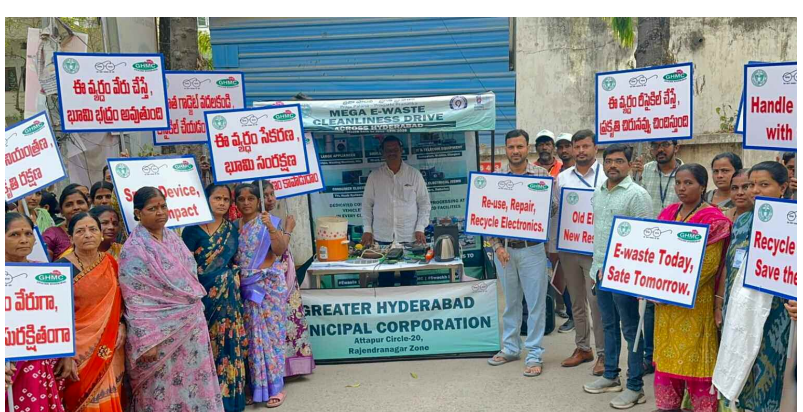
ఈ వేస్ట్ కలెక్షన్ సెంటర్