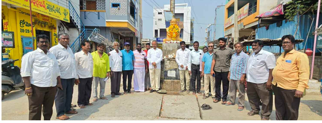
అమరజీవి పాట్లీ శ్రీరాములు విగ్రహానికి నివాళులర్పిస్తున్న నాయకులు