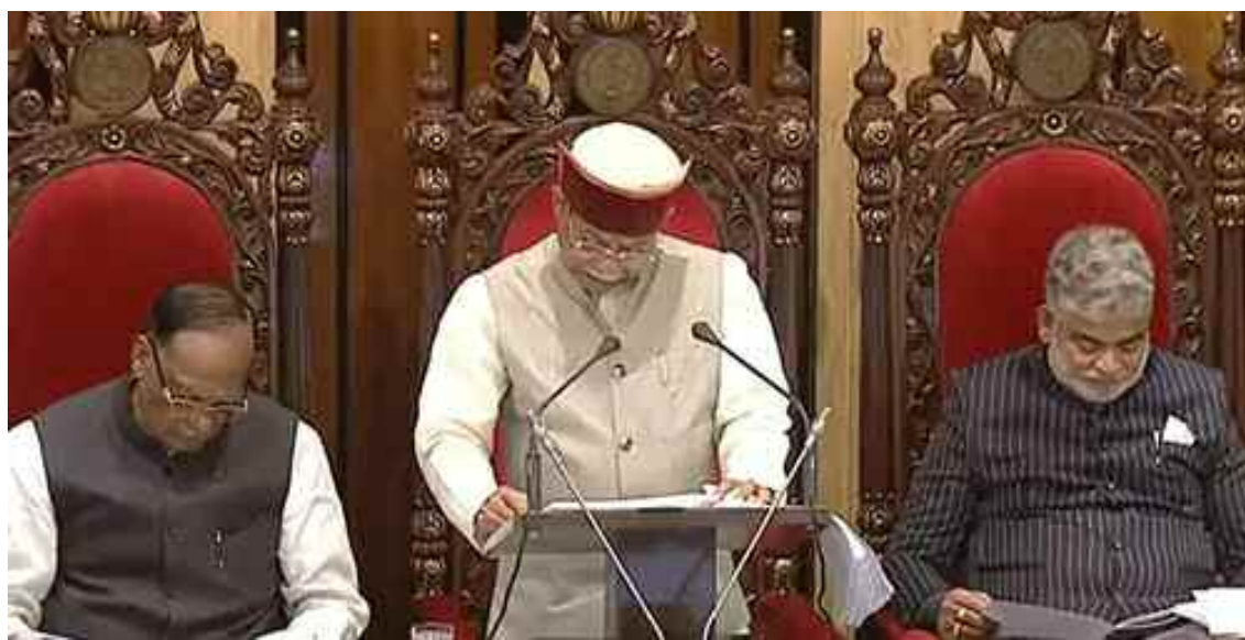
హైదరాబాద్, మార్చి 16 (నమస్తే ఉదయం)

హైద్రా ద్వారా రూ.60 వేల కోట్ల ప్రభుత్వ ఆస్తులను కాపాడమని తెలంగాణ రాష్ట్ర గవర్నర్ శివప్రతాప్ శుక్లా అన్నారు. తెలంగాణ అసెంబ్లీ బడ్జెట్ సమావేశాల ప్రారంభం సందర్భంగా ఉభయ సభలను ఉద్దేశించి ఆయన మాట్లాడారు. శ్రమించేతప్పు కలిగిన తెలంగాణ ప్రజలందరికీ శుభాకాంక్షలు అని ఆయన ప్రసంగాన్ని ప్రారంభించారు. ప్రజాకేంద్రీకృత పాలన ప్రభుత్వం విధానమని అన్నారు. విజన్ 2047 ద్వారా 3 ట్రీలియన్ డాలర్ల ఆర్థిక వ్యవస్థకు రోడ్ మ్యాప్ రూపొందించినట్లు తెలిపారు. రాష్ట్ర తలసరి ఆదాయం రూ.4.18 లక్షలకు చేరుకుందని తెలిపారు. క్యూర్, ఫ్యూర్, రేర్ మోడల్ ద్వారా రాష్ట్రాభివృద్ధి కోసం ప్రభుత్వం ప్రణాళికలు