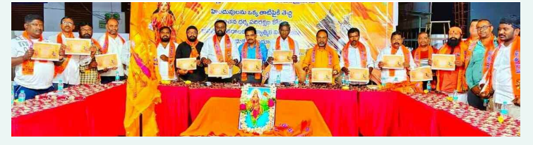
వాల స్పోర్ట్స్ అభివృద్ధి కార్యక్రమంలో పాల్గొన్న హిందూ సమ్మేళనం ప్రతినిధులు