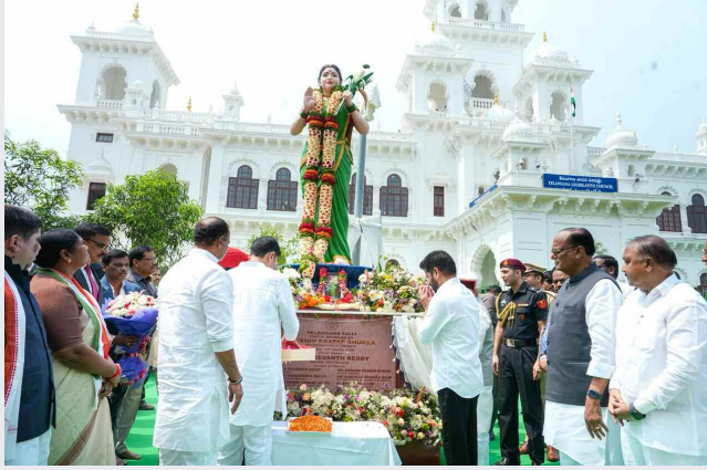
హైదరాబాద్, మార్చి 16 (నమస్తే ఉదయం)

ఆవిష్కరించిన గవర్నర్ శివ ప్రతాప్ శుక్లా కార్యక్రమంలో పాల్గొన్న రేవంత్, మల్లు భట్టి, పలువురు మంత్రులు ఈ విగ్రహం తెలంగాణ ప్రజల ఆత్మగౌరవానికి నిదర్శనమన్న రేవంత్