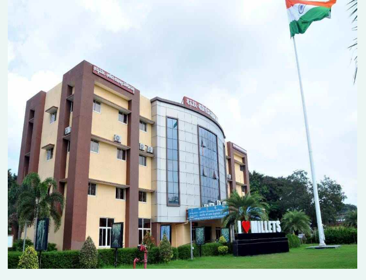
రాజేంద్రనగర్ లోని బి బి ఎం ఆర్