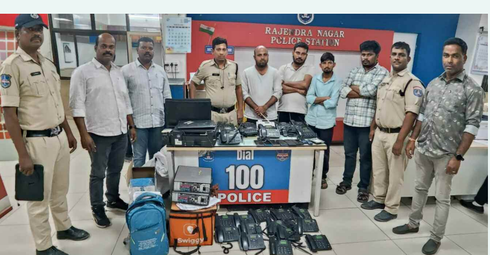
పోలీసుల అభివృద్ధి నిందితుడు

నేరుగా పనిచేయడం ద్వారా అత్యుత్సాహాన్ని పెంపొందించుకున్నారు గుర్తు చేశారు. కొత్త సాంకేతికతలను స్వయంగా ప్రయత్నించారన్నారు. ఈ అనుభవం విద్యార్థులలో ఆసక్తి, ఉత్సాహాన్ని పెంచి నేర్చుకునే ప్రక్రియను సరదాగా, ప్రయోజనకరంగా మార్చిందని తెలిపారు.