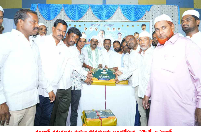
రంజాన్ కనుకలను ముస్లిం సోదరులకు అందించేస్తున్న ఎమ్మెల్యే జిఎంఆర్

కొత్తకోట, మార్చి 17 (నమస్తే ఉదయం) రంజాన్ పండుగని పురస్కరించుకొని పట్టణంలోని ఖాద్రి మసీదులో ముస్లిం సోదరులతో కలిసి ఎమ్మెల్యే ప్రత్యేక ప్రార్థనలో పాల్గొన్నారు. అనంతరం క్యూ ఆర్ ఫంక్షన్ హాల్ లో రాష్ట్ర ప్రభుత్వం ఏర్పాటు చేసిన రంజాన్ తోషాను ముస్లిం