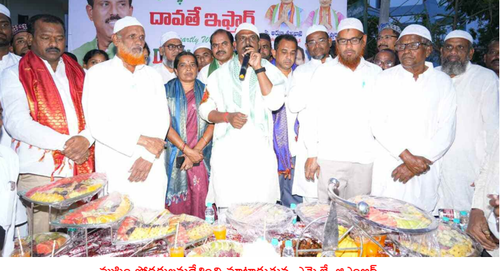
ముస్లిం సోదరులను సేవించి మాట్లాడుతున్న ఎమ్మెల్యే జిఎంఆర్

సోదరులకు అందజేశారు. అనంతరం విందులో ఎమ్మెల్యే పాల్గొని మాట్లాడుతూ, కులాలకు మతాలకు అతీతంగా జరుపుకునే పండుగ రంజాన్ పండుగని మైనార్టీ సోదరులు పండగను సుఖ సంతోషాలతో జరుపుకోవాలని కాంగ్రెస్ ప్రభుత్వం పై మాపై అల్లా దీవెనలు ఎల్లప్పుడూ ఉండాలని అన్నారు. ఈ కార్యక్రమంలో కాంగ్రెస్ పార్టీ నాయకులు మైనార్టీ సోదరులు పాల్గొన్నారు.