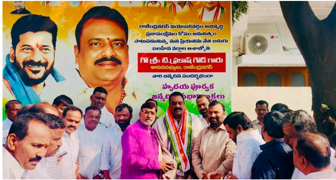
ఎమ్మెల్యే ప్రకాష్ గౌడ్ సన్మానించిన ప్రణవభక్త సమాజం ప్రతినిధులు

రాంబాగ్ శివాలయం,కాలా హనుమాన్ దేవాలయం పరిసర ప్రభుత్వ భూమి పరిరక్షణలో ఎమ్మెల్యే ప్రకాష్ గౌడ్ చూపిన చొరవ మరచలేనిదిని పలువురు నాయకులు అన్నారు. అత్యున్నత సీతారామచంద్రస్వామి దేవాలయం, రాంబాగ్ శివాలయం దేవాలయం పరిసరాల లోని ప్రభుత్వ భూమిలో జరిగిన అక్రమణలను తొలగించడంలో కీలక పాత్ర ఎమ్మెల్యే ప్రకాష్ గౌడ్ ను మంగళవారం ప్రణవ భక్త సమాజం సభ్యులు ఘనంగా సన్మానించారు. ఈ మేరకు ఎమ్మెల్యే ప్రకాష్ గౌడ్ ను ఆయా పార్టీల నాయకుడు స్వామికులు మర్యాదపూర్వకంగా కలిసి ఎమ్మెల్యేకు కృతజ్ఞతలు తెలిపారు. రాంబాగ్, వాండరంగ నగర్, హుడా కాలనీ, అత్యున్నత, నంది ముసలైగూడ, హైదర్ గూడ, ఉప్పవల్లి, శాంతినగర్ ప్రాంతాల ప్రజలు, భక్తులు కలిసి రాంబాగ్ రామాలయం, శివాలయం, కాలా హనుమాన్ దేవాలయం పరిసర ప్రాంతంలో ఉన్న ప్రభుత్వ భూమిపై జరిగిన అక్రమ ఆక్రమణలను వ్యతిరేకించారు. తొలగించడంలో కీలక పాత్ర పోషించిన ఎమ్మెల్యే ప్రకాష్ గౌడ్ కు కృతజ్ఞతలు తెలిపారు. ఎమ్మెల్యే ప్రకాష్ గౌడ్ చొరవ, నాయకత్వం, పట్టుదలతో సంబంధిత అధికారుల ద్వారా అక్రమ ఆక్రమణలను తొలగించే చర్యలు తీసుకోవడంపై ప్రజలు తెలిపారు. ఈ చర్యలు దేవాలయాల పరిసర ప్రాంతాన్ని, ప్రభుత్వ భూమిని రక్షించడంలో ఎంతో