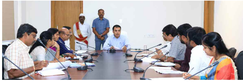
అధికారులతో సమీక్ష చేస్తున్న జిల్లా కలెక్టర్