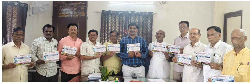
నీటి సంరక్షణపై గౌరవ ప్రతిపదికలను చేస్తున్న అసోసియేషన్ సభ్యులు, జలమండలి అధికారులు.