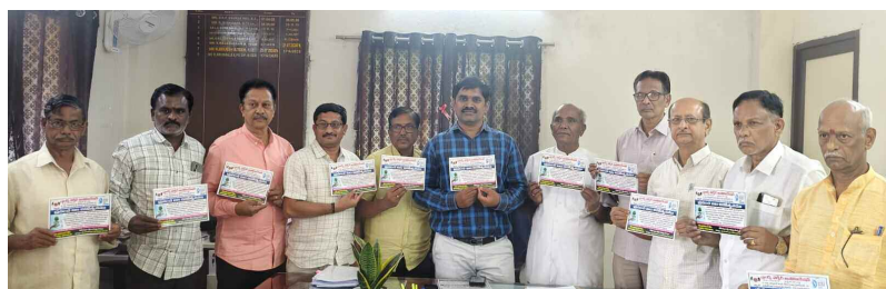
నీటి సంరక్షణ గోడ పత్రిక విడుదల చేస్తున్న అసోసియేషన్ సభ్యులు. జలమండలి అధికారులు.

రంజాన్ మాసం ఉపవాస దీక్షలు ముగిసాయి. శుక్రవారం భారత్ లో నెలవంక కనిపించింది. దీంతో దేశవ్యాప్తంగా ముస్లింలు శనివారం ఈద్-ఉల్-ఫితర్ (రంజాన్) పండుగ జరుపుకుంటారు. వాస్తవానికి శుక్రవారమే రంజాన్ ఉంటుందని తొలుత అంతా భావించారు. కానీ ముందురోజు నెలవంక కనిపించడంతో ప్రభుత్వం సాధారణ పని దినంగా ప్రకటించింది. అయితే.. వెంటనే పరిస్థితిని పరిశీలించిన ప్రభుత్వం రంజాన్ పండుగను శనివారం జరుపుకోవాలని నిర్ణయించింది. దీనికి అనుగుణంగా శనివారం అధికారికంగా సెలవు ప్రకటనూ ప్రభుత్వం ఉత్తర్వులు జారీ చేసింది. పవిత్ర దివ్య ఖురాన్ అవతరించిన ఈ మాసంలో కఠిన ఉపవాస దీక్షల అనంతరం ఈ వేడుకను జరుపుకోవచ్చునని ముస్లిం సోదరులు, మనిషిలోని చెదల భావనల్ని అధర్మాన్ని దేస్సాన్ని రూపుమాపే గొప్ప పండుగ 'ఈద్-ఉల్-ఫితర్' అని ముస్లింలు భావిస్తారు.