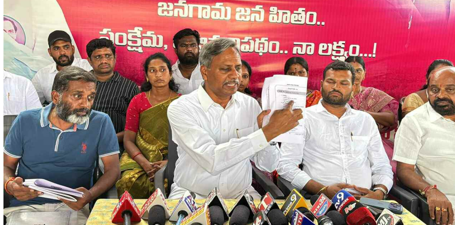
విలేకరుల సమావేశం లో మాట్లాడుతున్న ఎమ్మెల్యే పల్లా

ఆరు గ్యారంటీలు మాట్లాడిన...కాంగ్రెస్ ప్రభుత్వం ఖర్చు సున్నా