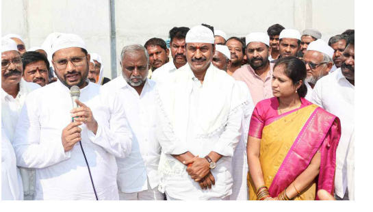
ఈడా వద్ద ప్రార్థనలో పాల్గొన్న తిలీవన్ నాయకులు