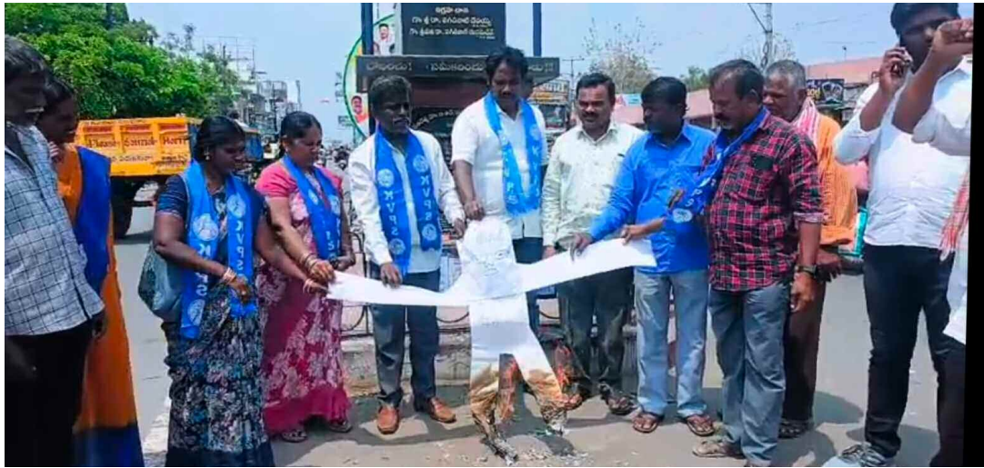
రాష్ట్ర ప్రభుత్వం దిష్టి బొమ్మను దహనం చేస్తున్న కెపిఎస్ నాయకులు