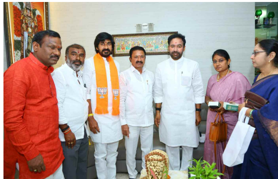
కేంద్ర మంత్రి కిషన్ రెడ్డిని కలిసిన రంగారెడ్డి జిల్లా జిజిబి నాయకులు