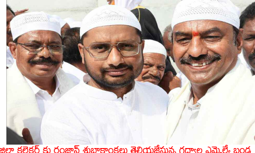
జిల్లా కలెక్టర్ కు రంజాన్ శుభాకాంక్షలు తెలియజేస్తున్న గద్వాల ఎమ్మెల్యే బండ

గద్వాల జిల్లా ప్రతినిధి, మార్చి 21 (నమస్తే ఉదయం)