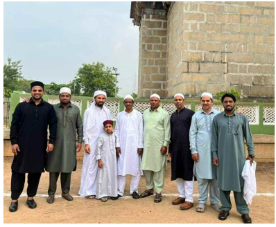
ప్రేమావతిపేట లోని మసీదు వద్ద ముస్లిం సోదరులు