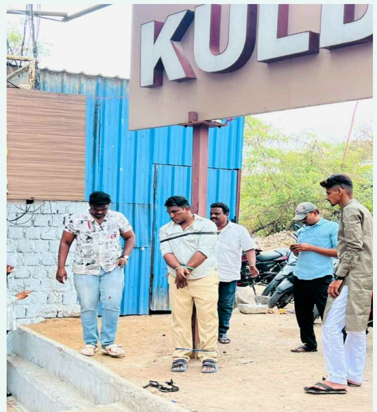
ఆలో దొంగ కు దేహ శుద్ధి