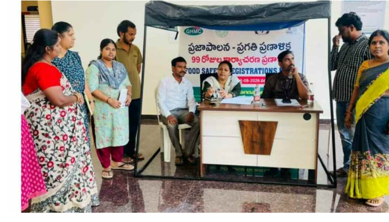
2) పథకాలపై వీధి వ్యాపారులకు అవగాహన కల్పిస్తున్న డిపిఓ, స్వాతి