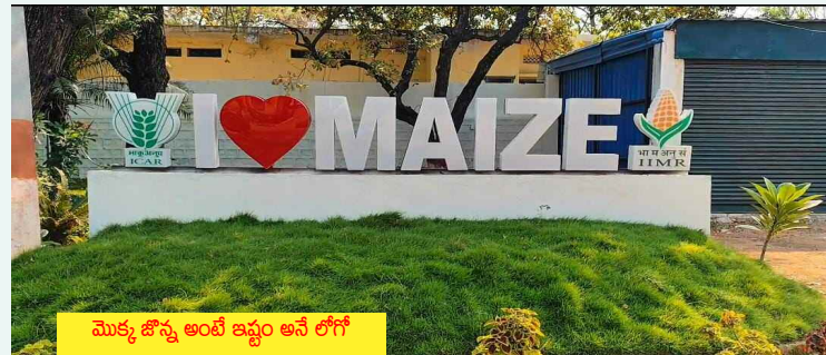
మొక్కజొన్న అంటి ఇష్టం అనే లోగో