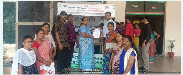
విరు వ్యాపారులకు దృవీకరణ పత్రాలను అందచేస్తున్న అత్తాపూర్ సర్కిల్ డిప్యూటీ కమిషనర్ వి సమ్యక్య