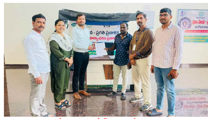
1) వీధి వ్యాపారులకు రిజిస్ట్రేషన్ పత్రాలను అందజేస్తున్న అధికారి