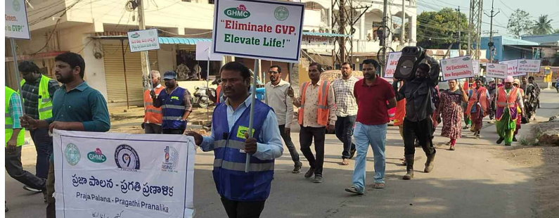
రాల్స్ నిర్వహిస్తున్న జిహెచ్ ఎం సీ అధికారులు, సిబ్బంది