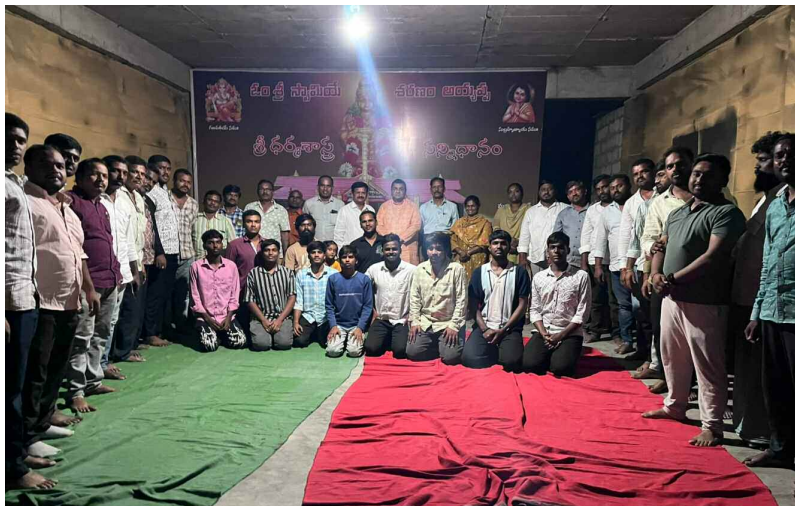
బుద్వేల్ రైల్వే స్టేషన్ బస్టోల్ సమావేశమైన హిందూ సమ్మేళనం ప్రతినిధులు