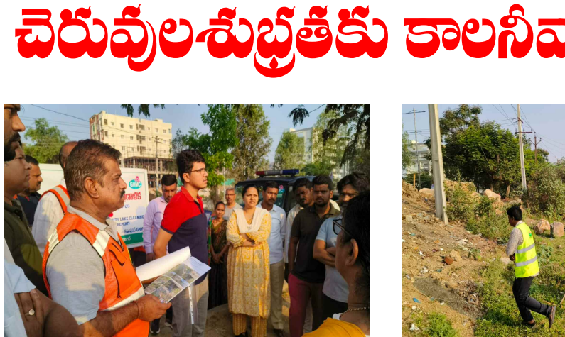
స్వచ్ఛ ఆదివారం కార్యక్రమంలో భాగంగా పీఠం చెరువు శుభ్రత చేపట్టిన జిహెచ్ఎస్ఐ అధికారులు