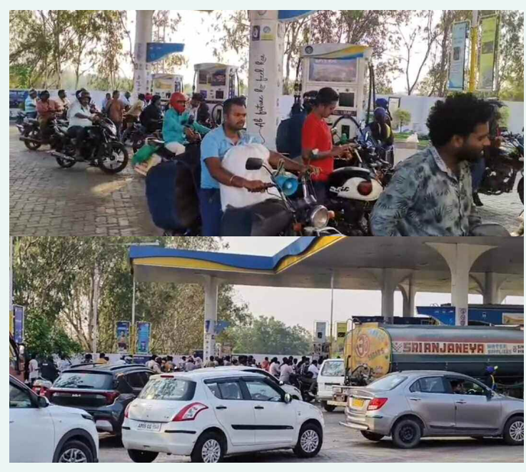
రాజేంద్రనగర్ లో పెట్రోల్ బంకల వద్ద రద్దీ