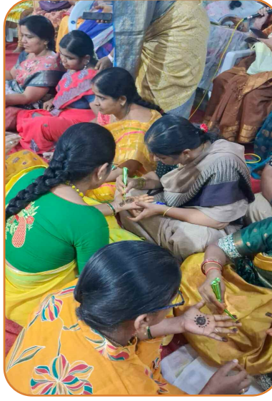
రాజేంద్రనగర్, మార్చి 26 (నమస్తే ఉదయం)