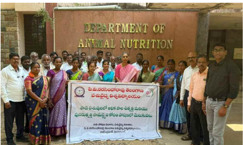
శిక్షణలో పాల్గొన్న రైతులు