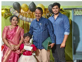
పెద్ద నాన్న అప్పారెడ్డి గూడెం భవయ్య కుటుంబం తో..