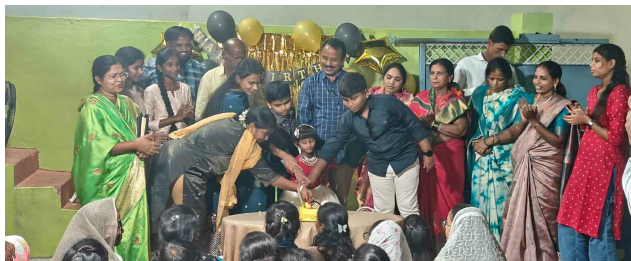
కేకీ కట్ చేస్తున్న శ్రేష్ట బ్లెస్సి