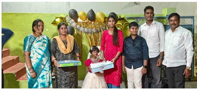
అత్త విజయ లక్ష్మి కుటుంబం తో..