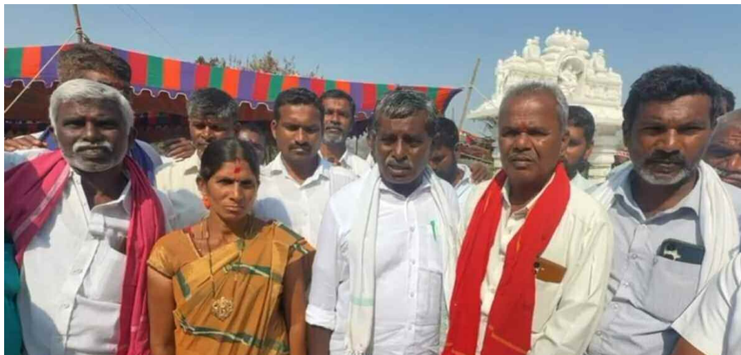
మాట్లాడుతున్న ఎస్సీ, ఎస్టీ సర్పంచ్ లు

జనగామ జిల్లా ప్రతినిధి, మార్చి 03 (నమస్తే ఉదయం)