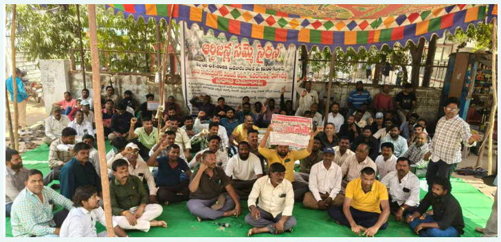
శివరాపల్లి లో గల రాజేంద్రనగర్ విద్యుత్ ఓ ఈ కార్యాలయం ముందు నిరసన వ్యక్తం చేస్తున్న ఆర్జిజన్లు