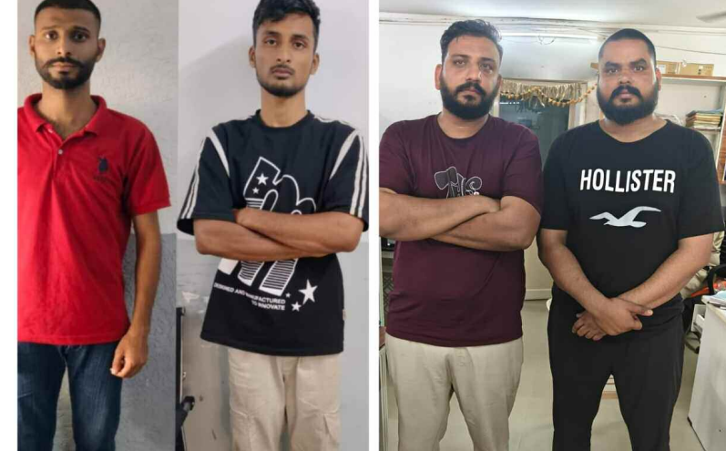
పాన్ షాప్ నిర్వాహకునిపై దాడి చేసిన యువకులు