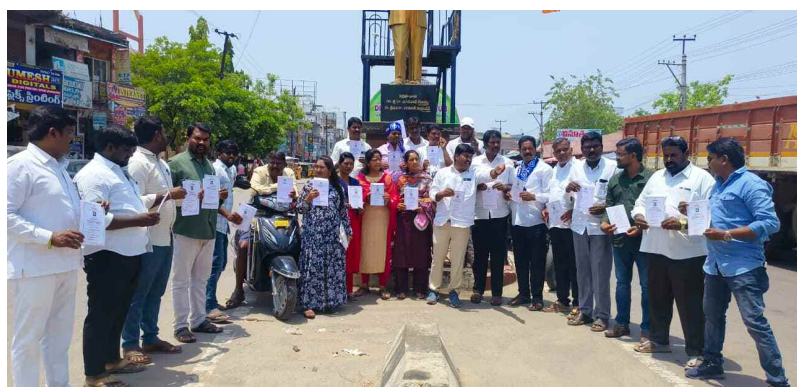
ఇన్ఫోవీన్ కార్డ్స్ విడుదల చేస్తున్న నాయకులు