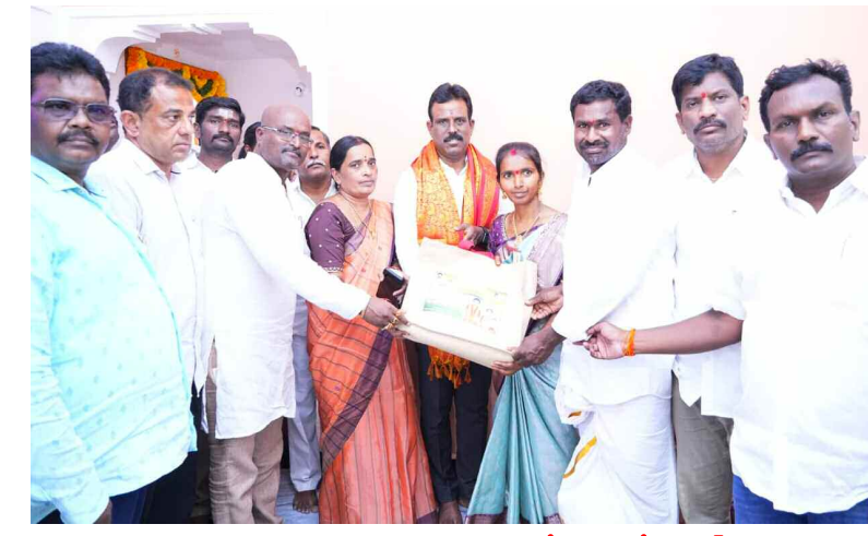
ఇందిరమ్మ ఇళ్ల గృహప్రవేశంలో పాల్గొన్న ఎమ్మెల్యే జిఎంఆర్

కొత్తకోట మున్సిపాలిటీ కేంద్రం, కనిమెట్ల, పాలెం గ్రామాలలో పలు దేవరక్షల్లో ఎమ్మెల్యే జిఎంఆర్ ఇందిరమ్మ ఇండ్ల గృహప్రవేశ కార్యక్రమాల్లో పాల్గొని లబ్ధిదారులకు శు