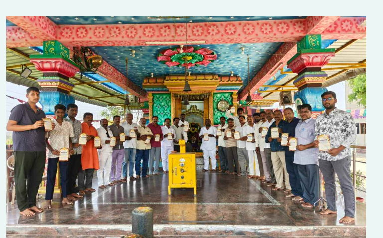
హిందూ సమ్మేళనం సాగర్ ఆవిష్కరిస్తున్న బుద్వేల్ హైందూ సోదరులు