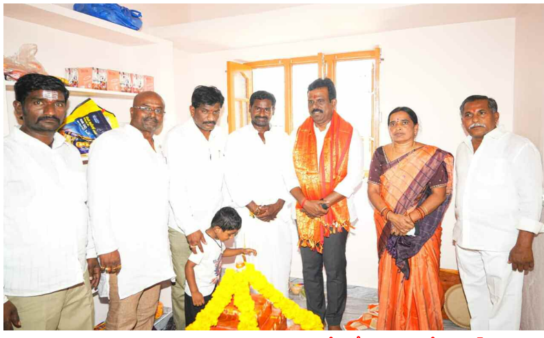
ఇందిరమ్మ ఇళ్ల గృహప్రవేశంలో పాల్గొన్న ఎమ్మెల్యే జిఎంఆర్