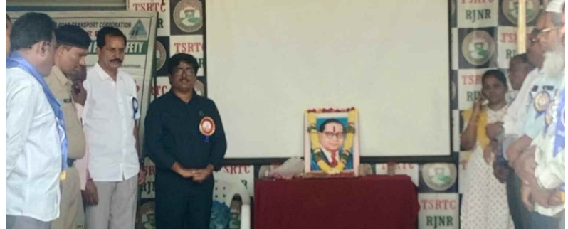
రాజేంద్రనగర్ ఆర్డీసీ డిపోలో ఘనంగా డాక్టర్ అంబేద్కర్ జయంతి వేడుకలు