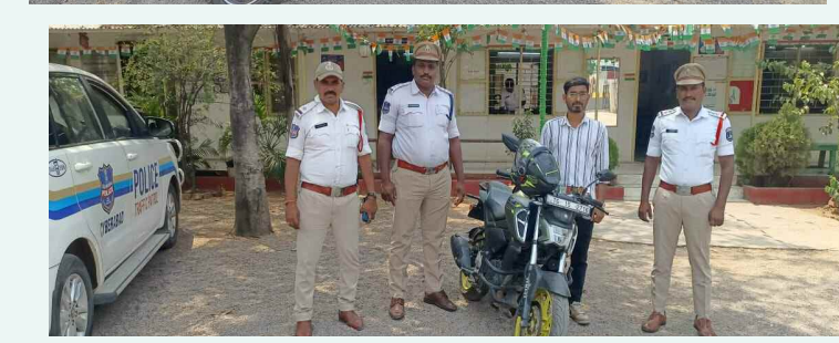
హిమాయత్ సాగర్ ఔటర్ రింగ్ రోడ్డులో ద్వి చక్ర వాహనాలపై తిరుగుతున్న వారిని పట్టుకుని ఫైన్ వేసిన రాజేంద్రనగర్ ట్రాఫిక్ పోలీసులు