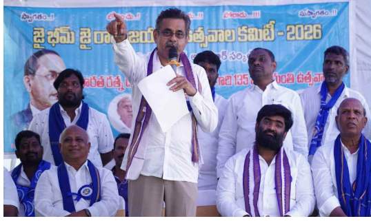
అంబేద్కర్ జయంతి వేడుకలో మాట్లాడుతున్న ఎంపీ కాండా విశ్వేశ్వర్ రెడ్డి