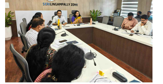
శేరిలింగంపల్లి జోన్ జయకుమ్మ ఆశాపూర్ణ పనులపై జరిగిన సమీక్షా సమావేశం మాట్లాడుతున్న సీఎస్ఆర్ కమిషనర్ జిత్ర అధికారులు.

శేరిలింగంపల్లి జోన్ పరిధిలో ప్రజలకు మెరుగైన సౌకర్యాలు కల్పించడమే లక్ష్యంగా సిఎస్ఆర్ కమిషనర్ జి. స్వజన జోనల్ కార్యాలయంలో ఉన్నత స్థాయి సమీక్షా సమావేశం నిర్వహించారు. 99 రోజుల ప్రోగ్రాంలో భాగంగా పెండింగ్లో ఉన్న 190 అభివృద్ధి పనులను జూన్ నాటికి పూర్తి చేయాలని ఆయన అధికారులకు డెడ్ లైన్ విధించారు. రోడ్ల మరమ్మత్తులు ఆక్రమణల తొలగింపు ప్రయాణికులకు కష్టాలు కలగకుండా చూడాలని సూచించారు. ప్రధాన రహదారులకు ఎండ్రు ఎండ్ కార్పొరేషన్ చేయాలని కమిషనర్ ఆదేశించారు. జూన్ 2వ తేదీ నాటికి ఎక్కడా ఒక్క గుంత కూడా కనిపించకుండా మరమ్మత్తులు పూర్తి చేయాలని రోడ్లపై ఉన్న ఆక్రమణలను నిర్మూలనగా తొలగించాలని ఇంజనీరింగ్ అధికారులకు