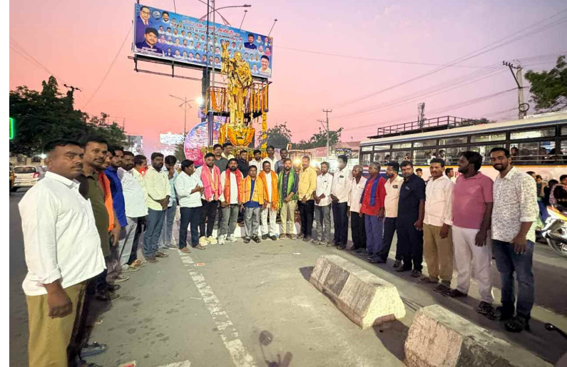
సన్మానం చేసిన ఎం.ఆర్.ఎస్ నాయకులు