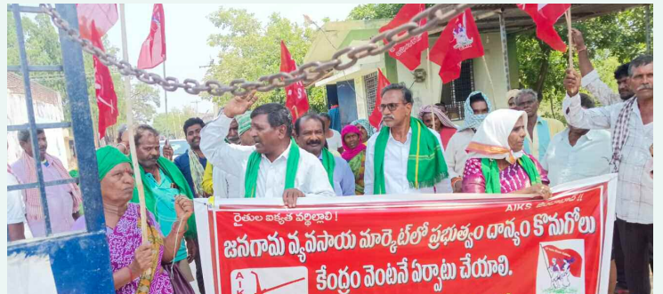
ఏఎంసీ గేటు ముందు ధర్మా చేస్తున్న రైతు సంఘం నాయకులు