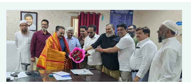
రాజేంద్రనగర్ జోనల్ కమిషనర్ సోలిపేట శ్రీనివాస్ రెడ్డి ని మ్యూజిక్ ఫౌండేషన్ కలనీన చౌక్లో కాలనీ ప్రతినిధులు