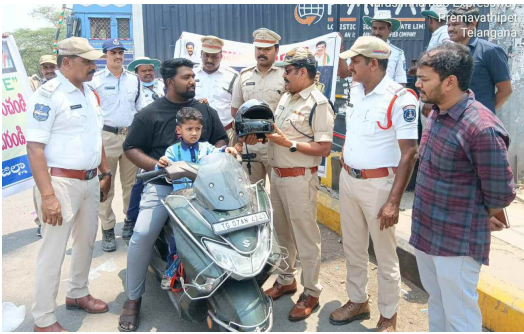
ఆరాంధ్రగర్ ఛౌసల్ వాన చరం ఏర్పాటు చేసి అవగాహన కల్పిస్తున్న విద్యార్థులు. పోలీసులు... బుద్వేల్ లో ఆర్టీసీ సిబ్బంది తో కలిసి రాళ్ళ నిర్వహిస్తున్న ట్రాఫిక్ పోలీసులు. హైల్డ్ ధంపాలని అవగాహన కల్పిస్తున్న ట్రాఫిక్ అడిషనల్ డీసీపీ రాంధాన శేఖావత్