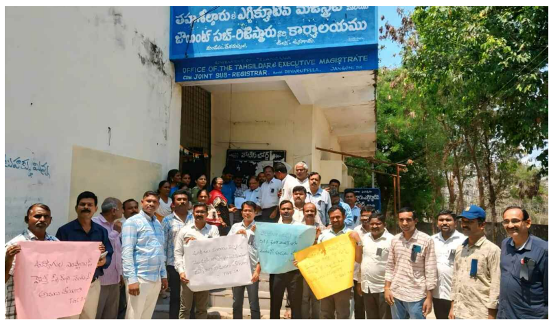
వినవేసిన ఇద్దరు నిరసన తెలుపుతున్న విఆర్ఎస్ వారసులు

శుక్రవారం లోకసభలో చర్చ సందర్భంగా తీవ్ర గందరగోళం ఏర్పడింది. నియోజకవర్గాల పునర్విభజన వల్ల జనాభా నియంత్రణను సమర్పవంతంగా అమలు చేసిన దక్షిణాది రాష్ట్రాలకు అన్యాయం జరుగుతుందని ప్రతిపక్షాలు ఆందోళన వ్యక్తం చేశాయి. మహిళా రిజర్వేషన్ బిల్లులో ఓటేసీ మహిళలకు ప్రత్యేక కోటా కేటాయింబాలని, కుల గణనను వెంటనే చేపట్టాలని రాహుల్ గాంధీ డిమాండ్ చేశారు. ఇప్పుడు కేంద్రం ప్రవేశపెట్టిన మహిళా కోటా బిల్లు మహిళల సాధికారత కోసం కాదని, కుల గణనను పక్కదారి పట్టించేందుకే దీన్ని తెరపైకి తెచ్చిందని ఆయన మండిపడ్డారు. దీనిపై అధికార పక్షం తీవ్రంగా స్పందించడంతో సభలో వాగ్వాదం చోటుచేసుకుంది. బీజేపీ అధికారాన్ని శాశ్వతం చేసుకునేందుకు చిన్న రాష్ట్రాలు, దక్షిణాది, ఈశాన్య రాష్ట్రాల ప్రాతినిధ్యాన్ని తగ్గించే కుట్ర చేస్తోందని ప్రతిపక్ష సభ్యులు నివాదాలు చేశారు.