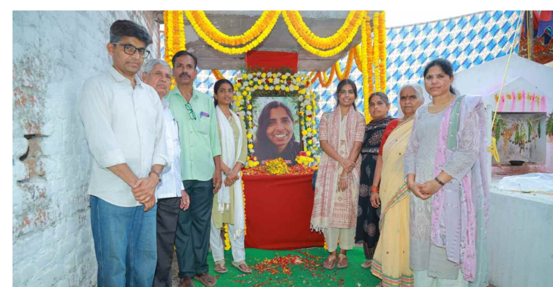
మిడ్కో కు నివాసాలు అందిస్తున్న కుటుంబం సభ్యులు