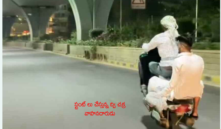
స్టాల్ లు చేపట్టిన దళిత వాహనదారుడు