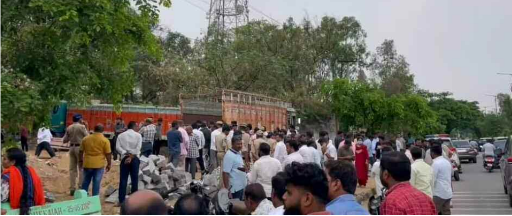
ఈస్టర్ హిల్స్ వద్ద గుమిగూడిన క్రైస్తవులు