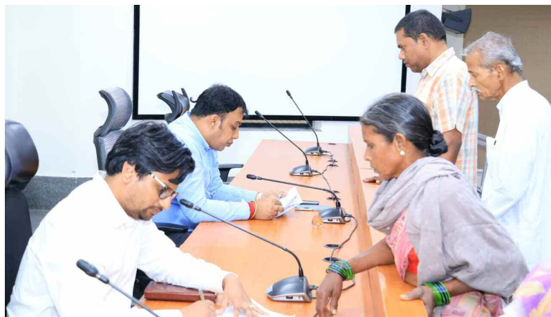
దరఖాస్తులు స్వీకరిస్తున్న కలెక్టర్, అదనపు కలెక్టర్