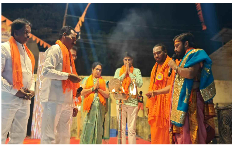
బుద్వేల్ బస్టిలో జరిగిన హిందూ సమ్మేళనం లో పాల్గొన్న వేద వందితులు, స్థానిక నాయకులు