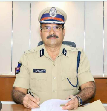
సైబరాబాద్ పోలీస్ కమిషనర్ డాక్టర్ రమేష్

సైబరాబాద్ పోలీస్ కమిషనర్ లో పరిధిలో ప్రారంభం కానున్న ఇంటర్మీడియట్ ఎస్.ఎస్.సి (తెలంగాణ ఓఎస్ సన్మాన్ సాసెటీ) పరీక్షల దృష్ట్యా కమిషనరేట్ పరిధిలోని అన్ని పరీక్షా కేంద్రాల వద్ద 144 సెక్షన్ అమలు చేస్తున్నట్లు సైబరాబాద్ పోలీస్ కమిషనర్ డా. ఎం. రమేష్ తెలిపారు. శాంతిభద్రతల పరిరక్షణ పరీక్షలు సజావుగా సాగేలా చూడటం కోసం ఈ నిర్ణయం తీసుకున్నట్లు ఆయన పేర్కొన్నారు. ఈ ఉత్తర్వులు ఏప్రిల్ 20 నుండి ఏప్రిల్ 27 వరకు ప్రతిరోజూ ఉదయం 6 గంటల నుండి సాయంత్రం 6 వరకు అమల్లో ఉంటాయని తెలిపారు. ఐదుగురు అంతకంటే ఎక్కువ మంది చేరరాదు. పరీక్షా కేంద్రాల చుట్టూ 200 మీటర్ల పరిధిలో ఐదుగురు లేదా అంతకంటే ఎక్కువ మంది వ్యక్తులు గుమిగూడటం నిషేధం. జిరాక్స్ సెంటర్ల మూసివేత పరీక్షా కేంద్రాలకు 100 మీటర్ల లోపు ఉన్న అన్ని జిరాక్స్ సెంటర్లు ఇంటర్నెట్ సెంటర్లను పరీక్షా సమయంలో మూసి ఉంచాలి. ఈ నిబంధనలను ఉల్లంఘించిన వారిపై చట్టపరమైన కఠిన చర్యలు తీసుకోవడం జరుగుతుందని కమిషనర్ హెచ్చరించారు. విధులు నిర్వహిస్తున్న పోలీస్ అధికారులు మిలిటరీ సిబ్బంది, హోం గార్డులు, విద్యాశాఖకు చెందిన ఫ్లయింగ్ స్క్వాడ్ అధికారులకు వర్తించని తెలిపారు. పరీక్షలు పారదర్శకంగా ప్రశాంత వాతావరణంలో జరిగేందుకు ప్రజలు పోలీసులకు సహకరించాలని కమిషనర్ కోరారు.