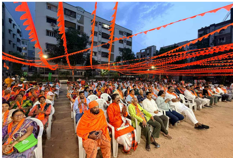
హిందూ సమైక్యతానికే హోదా ఇచ్చిన భక్తులు.

శ్రీనివాసంపల్లి : ఏప్రిల్ 20, (నమస్తే ఉదయం)