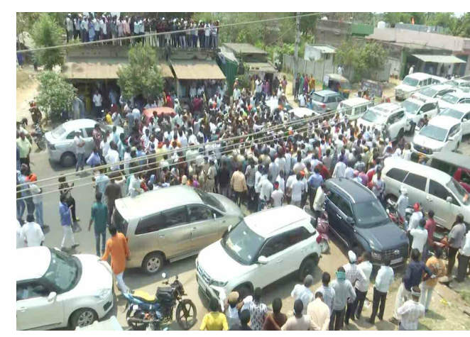
హైదరాబాద్, ఏప్రిల్ 24 (నమస్తే ఉదయం)