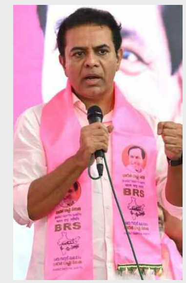
హైదరాబాద్, ఏప్రిల్ 24 (నమస్తే ఉదయం)

ఆర్టీసీ కార్మికులకు రేవంత్ తీరని ద్రోహం బిఆర్ఎస్ వర్కింగ్ ప్రెసిడెంట్ కేటీఆర్