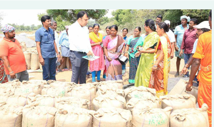
బకీ సింథర్ ను తనిఖి చేస్తున్న జిల్లా కలెక్టర్

సమస్యలను పట్టించుకోకుండా మోసం చేస్తే, నేటి కాంగ్రెస్ ప్రభుత్వం వారి సమస్యలను పట్టించుకోకుండా చర్యల పేరుతో కాలయాపన చేస్తోందని, కమిటీల పేరుతో సమస్యలను పక్కదారి పట్టిస్తోందని అగ్రహం వ్యక్తం చేశారు. ఆర్టీసీని కాపాడుకోవడం కార్మికుల బాధ్యతనే కాదు తెలంగాణ పౌర సమాజం బాధ్యత అని గుర్తు చేశారు. ప్రభుత్వ నిర్లక్ష్యం వీడాలంటే, హక్కులు నెరవేరాలంటే పోరాటమే మార్గమని, అందరినీ కలుపుకొని ప్రభుత్వాన్ని కదిలించేలా శక్తివంతమైన పోరాటాన్ని నిర్వహించాలని గుర్తుచేశారు. ఆర్టీసీ కార్మికులు ఆత్మహత్యలు చేసుకోవద్దని, ఆత్మస్వేచ్ఛాని కోల్పోకుండా హక్కుల కోసం పోరాడాలని కార్మికులకు విజ్ఞప్తి చేశారు. గత ప్రభుత్వంలో కూడా 30 మందికి పైగా కార్మికులు తమ ప్రాణాలను కోల్పోయారని, వీరి మీదనే ఆధారపడ్డ వారి కుటుంబాల కన్నీటి వ్యర్థ ఎవరూ తీర్చలేనిది గుర్తుచేశారు. ఆర్టీసీ కార్మికుల పోరాటంలో న్యాయం ఉన్నదని, దాని వెనుకనే విజయం ఉందని అందుకోసం రేపటి విజయ ఫలాలు పొందడానికైనా