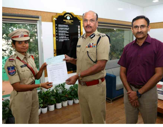
డి.జి.ఎస్.పి.చేతుల మీదుగా ప్రశంసా పత్రం