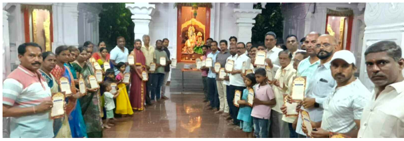
హిందూ సమ్మేళనం పోస్టర్ విడుదల చేస్తున్న హైదరాబాద్ ప్రతినిధులు