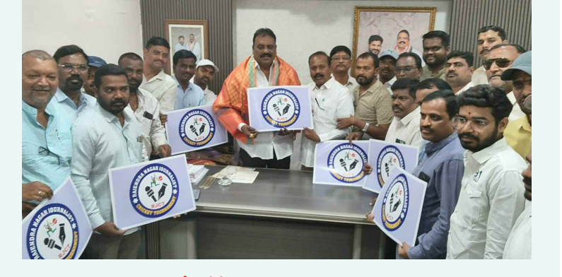
జర్నలిస్టు క్రికెట్ పోటీ లోగ్ ను అభిషేకిస్తున్న రాజేంద్రనగర్ ఎమ్మెల్యే డి. ప్రకాష్ గౌడ్

ప్రాఫెసర్ జయశంకర్ తెలంగాణ వ్యవసాయ విశ్వవిద్యాలయం 0 ద్వారా వచ్చే విద్యా సంవత్సరం నుంచి 30 బీఎస్సీ హార్దికల్లర్, 8 ఎమ్మెస్సీ సీట్లు భర్తీ చేయనున్నట్లు వార్తలు వస్తుండటంతో రాజేంద్రనగర్ లో ఉన్న హార్దికల్లర్ కళాశాల విద్యార్థులు శనివారం నిరసన కు దిగారు. 2007లో ప్రత్యేకంగా ఉద్యోగ విశ్వవిద్యాలయం ఏర్పడిందని గుర్తు చేశారు. హార్దికల్లర్ సీట్లు ఏమైన భర్తీ చేయాలంటే ఉద్యోగ విశ్వవిద్యాలయం నుంచి చేయాల్సి ఉంటుందన్నారు. అలా కాకుండా వ్యవసాయ విశ్వవిద్యాలయంలో హార్దికల్లర్ సీట్లు భర్తీ చేస్తే ఉద్యోగ విశ్వవిద్యాలయం ఉనికికి ప్రమాదం ఏర్పడుతుందన్నారు. ప్రభుత్వం స్పందించి ఉద్యోగ విశ్వవిద్యాలయంలోనే హార్దికల్లర్ సీట్లను భర్తీ చేయాలన్నారు. ఎట్టి పరిస్థితులలో వ్యవసాయ విశ్వవిద్యాలయం ద్వారా హార్దికల్లర్ సీట్లను భర్తీ చేయించవద్దన్నారు.