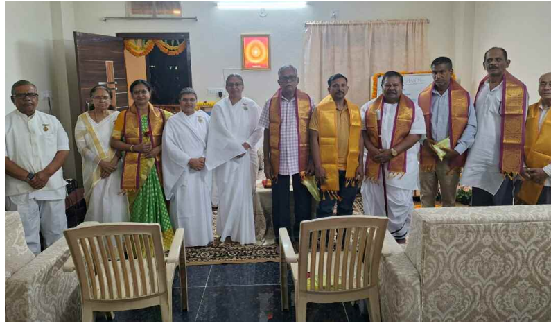
ఆధ్యాత్మిక కార్యక్రమంలో పాల్గొన్న బ్రహ్మ కుమారీలు, స్థానిక నాయకులు