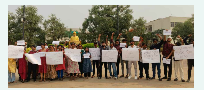
రాజేంద్రనగర్లో నిరసన తెలుపుతున్న ఉద్యోగ కళాశాల విద్యార్థులు