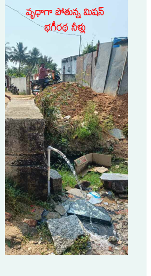
వృధాగా పోతున్న మిషన్ భగీరథ నీళ్లు

మల్లకల్ మండల పరిధిలో తాటికుంట గ్రామంలో మిషన్ భగీరథ నల్లాలకు ట్యాప్ పెట్టకుండానే అధికారులు వదిలేయడంతో నల్ల నుంచి నీరు వృధాగా పోతోంది. ఉదయం, రాత్రి తేడా లేకుండా తాగునీరు నేల పాలవుతుందని గ్రామస్థులు ఆవేదన వ్యక్తం చేస్తున్నారు. ఈ నీరు మురుగు కాలువల గుండా ప్రవహించి పొలాల్లో చేరి నిండుతున్నాయని చెబుతున్నారు. సంబంధిత అధికారులకు విషయం తెలిసినా అటు వైపుగా కన్నెత్తి చూడడం లేదని ఆరోపిస్తున్నారు. ఇప్పటికే నా అధికారులు నల్ల కనెక్షన్లకు ఆన్ ఆఫ్ లను వెంటనే అమర్చి నీటి వృధాను ఆరికట్టాలా చర్యలు తీసుకోవాలని గ్రామస్థులు కోరుతున్నారు.