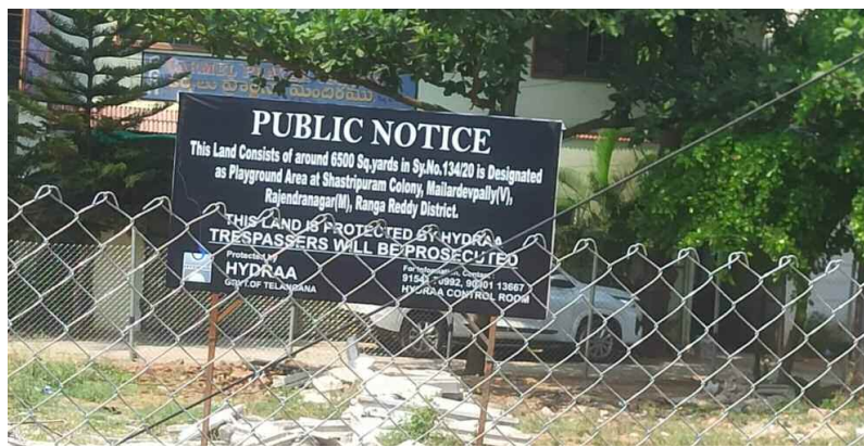
ఫెన్సింగ్ చేసి బోర్డు ఏర్పాటు చేసిన అధికారులు

కేటాయింపిన స్థలంలో అక్రమ నిర్మాణాలను హైద్రా తొలగించింది. జీ ప్లన్ 3 అంతస్తుల నిర్మాణ దశలో ఉన్న భవనాలు ఐదొంటిని హైద్రా తొలగించింది. మరో రెండు సింగిల్ రూమ్ నిర్మాణాలను తొలగించింది. 1800 ల ప్లాట్లకు పైగా ఉన్న ఈ టేబిల్ ప్రకారం 6500 గజాల స్థలాన్ని ప్లె గ్రౌండ్ కోసం కేటాయించారు. క్రీడస్థలానికి కేటాయింపిన స్థలం అని తెలిసి కూడా గత 3 సంవత్సరాలుగా నోటిఫికేషన్లకు ఉన్న కట్టడాలు పూర్తిగా ఆపివేస్తున్నారు. ఎలాంటి అనుమతులు లేకుండా నిర్మాణాలు చేపడుతున్నారు. జీపాన్ ఎం సీ గతంలో నోటిఫికేషన్లకు కూడా ఇచ్చింది. 2024లో డెమోలిషన్ చేస్తామని స్పీకింగ్ ఆర్డర్లు కూడా జారీ చేసింది. అయినా వట్టిచుక్కకుండా అక్కడ నిర్మాణాలు జరుగుతున్నాయి. యాద విషయమై స్థానికులు హైద్రాకు ఫిర్యాదు చేశారు. హైద్రా అధికారులు జీపాన్ ఎం సీ, రెవెన్యూ అధికారులతో కలిసి