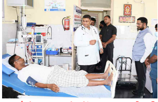
ఆస్పత్రిలో బికిత్త పొందుతున్న వ్యక్తిని ఆడిగి తెలుసుకుంటున్న కలెక్టర్ రిజ్వన్

ఇందిరమ్మ ఇండ్ల నిర్మాణంలో ఇసుక కొరత లేకుండా చూడాలని జిల్లా కలెక్టర్ రిజ్వన్ బాషా షేక్ సంబంధిత అధికారులను ఆదేశించారు. బుధవారం జిల్లా కలెక్టర్ అలంపూర్ తహసీల్దార్ కార్యాలయంలో పలువురు అధికారులతో సమావేశమై మాట్లాడారు. ఇందిరమ్మ ఇళ్ల నిర్మించుకునేందుకు లబ్ధిదారులు అధిక ధరలు చెల్లించి ప్రైవేట్ వ్యక్తుల నుంచి ఇసుక కొనుగోలు చేయవద్దని, ప్రభుత్వం నుంచి నిబంధనల ప్రకారం కొనుగోలు చేసేలా సంబంధిత అధికారులు లబ్ధిదారులకు సహకరించాలన్నారు. ఇందిరమ్మ ఇండ్ల నిర్మాణం వేగవంతం కావాలని, ప్రభుత్వ లక్ష్యం మేరకు నిర్మాణాలు పూర్తి చేయాలన్నారు. సెన్సెస్ పై ఇప్పటికే జిల్లాలో కార్యకలాపాలు మొదలయ్యాయని, సంబంధిత అధికారులు ప్రభుత్వ నిబంధనల ప్రకారం ముందుకెళ్లాలన్నారు. ఈ సందర్భంగా కలెక్టర్ తహసీల్దార్