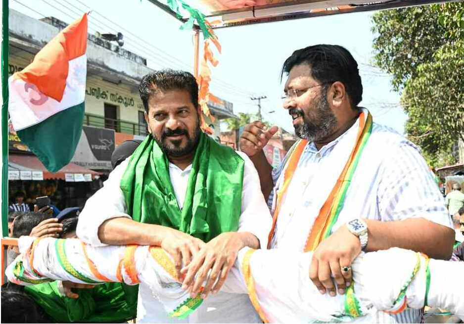
త్రివేంద్రం, ఏప్రిల్ 1 (నమస్తే ఉదయం)

కేరళలో లెఫ్ట్ డెమోక్రటిక్ ఫ్రంట్ (ఎల్డీఎఫ్)కు ఓటు వేస్తే బీజేపీకి వేసినట్టేనని రాష్ట్ర ముఖ్యమంత్రి ఎ.రేవంత్ రెడ్డి వ్యాఖ్యానించారు. ఢిల్లీ కమ్యూనలిస్టు ప్రధాని సరేంద్ర మోదీ, త్రివేంద్రం కమ్యూనిస్టు ముఖ్యమంత్రి పినరయ విజయన్ ను ఓడగొడితేనే కేరళకు మంచి రోజులు వస్తాయన్నారు. మోదీ-- విజయన్ లను విభిన్న భావజాలాలైనా, భావాలోకతనని, ఎల్డీఎఫ్-- బీజేపీ మధ్య