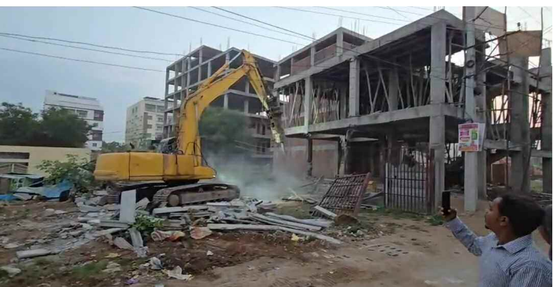
శాస్త్రపూర్వకంగా హైద్రా కట్టడం చేశారు...