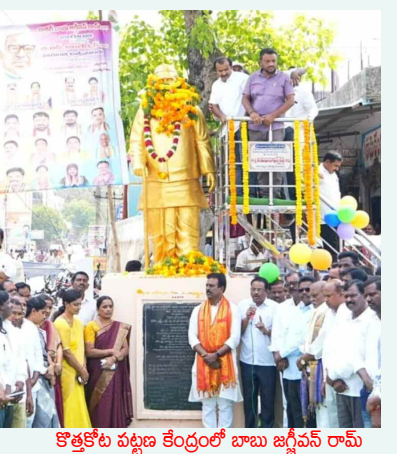
కొత్తకోట పట్టణ కేంద్రంలో బాబు జగ్జీవన్ రామ్ జయంతి సందర్భంగా ఆయన విగ్రహానికి పూలమాలలు వేసి నివాళులర్పిస్తున్న ఎమ్మెల్యే జిఎంఆర్