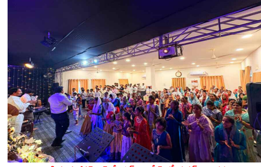
లక్ష్మీగూడ జీసస్ క్రైస్ట ప్రేయర్ మినిస్ట్రీ లో ఈస్టర్ ఆరాధనలు