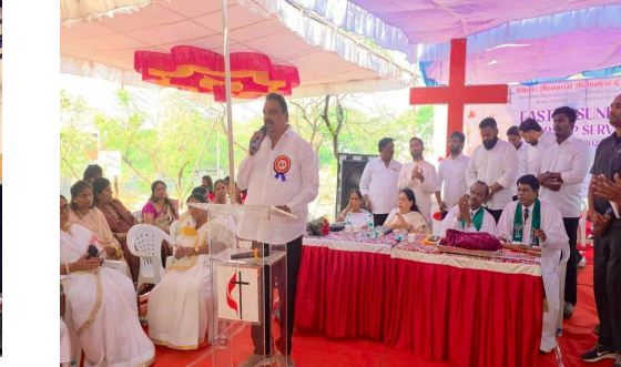
బుద్వేల్ ఈస్టర్ హిల్స్ లో మాట్లాడుతున్న ఎమ్మెల్యే డి ప్రకాష్ గౌడ్