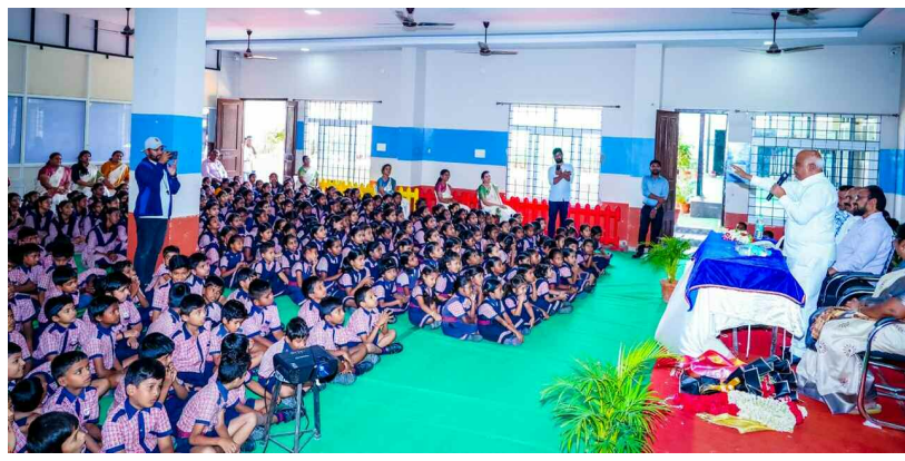
విద్యార్థులనుదేశంపై మాట్లాడుతున్న సమాచార హక్కు చట్టం కమిషనర్ దేశాల భూపాల్