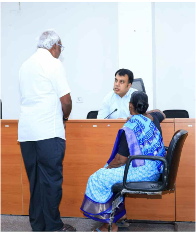
విద్యార్థులు కలెక్టర్ను జిల్లా కలెక్టర్

జిల్లా సమీకృత కలెక్టర్ కార్యాలయంలోని కాన్సెల్లెస్ హాల్ లో సోమవారం నిర్వహించిన ప్రజావాణిలో భాగంగా జిల్లా కలెక్టర్ సందీప్ కుమార్ ఝా అల్లీలను సమస్యల గురించి తెలుసుకుంటూ తగిన చర్యలు తీసుకోవాలని అధికారులను ఆదేశించారు. ఈ సందర్భంగా (286) అల్లీలను కలెక్టర్ స్వీకరించారు. ప్రజావాణిలో ఫిర్యాదుదారుల నుంచి వచ్చిన వివిధ సమస్యలకు అత్యంత ప్రాధాన్యతను ఇవ్వాలని, అదే విధంగా వచ్చిన దరఖాస్తులపై ప్రత్యేక శ్రద్ధ వహించాలని, వాటిని వెంటనే పరిష్కరించుటకు తగిన చర్యలు తీసుకోవాలని సంబంధిత శాఖ అధికారులకు సూచించారు. ఈ ప్రజావాణిలో అదనపు కలెక్టర్ (రెవెన్యూ) బెన్ షోలోన్, ఆర్డీఓ (స్టేషన్ మ్యాగ్) వెంకన్న, డీఆర్ఓఓ వసంత, వివిధ శాఖల సంబంధిత జిల్లా అధికారులు, తదితరులు పాల్గొన్నారు.