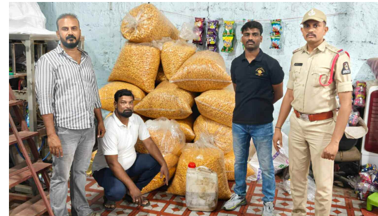
కుర్ కురే తయారీ గోదాము పై పోలీసుల దాడి

కర్తీ కుర్ కురే ఉత్పత్తులు, మసాలాలు తయారు చేస్తున్న రెండు పరిశ్రమలపై హైదరాబాద్ ఫుడ్ అడ్వలెన్స్ సర్వైస్ లెన్స్ టీం, ఫుడ్ సేఫ్టీ అధికారులు, మైలార్ డేవ్ వల్లి పోలీసులు సంయుక్తంగా దాడులు చేశారు. పోలీస్ స్టేషన్ పరిధిలోని టాటా నగర్ లో ఎలాంటి అనుమతులు లేకుండా