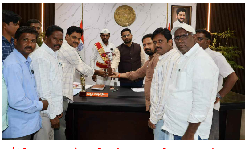
టీఆర్ఎస్ సంఘం అధ్యక్షులలో ప్రాథమిక పూర్తి చేయాలని జిల్లా కలెక్టర్ కు వినిపితం అందజేస్తున్న గ్రామ పరిపాలన అధికారులు