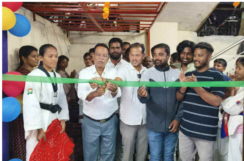
తైక్వాండో బాక్సింగ్ డ్యాన్స్ నూతన ఆకాడమీ ప్రారంభిస్తున్న దృశ్యం