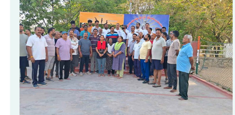
ఆరోగ్య దినోత్సవం లో పాల్గొన్న వాక్యస్