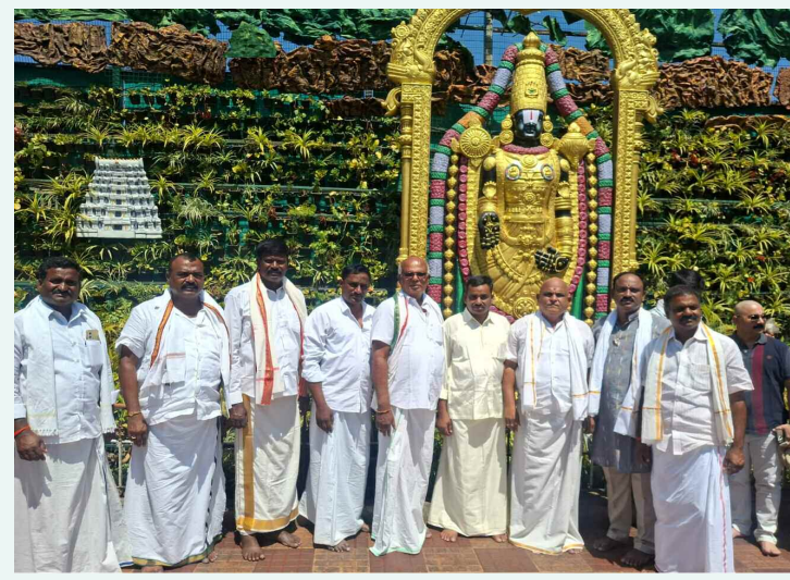
తిరుమల శ్రీవారిని దర్శించుకున్న కొత్తకోట మండల నాయకులు నమస్తే ఉదయం కొత్తకోట