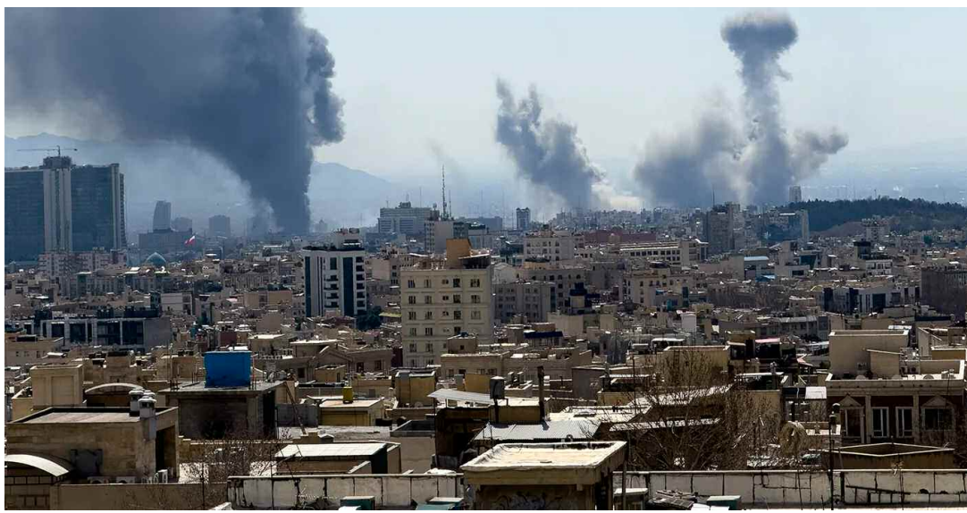
వ్యవస్థపై తీవ్ర ప్రభావం చూపుతోంది. ఈ నేపథ్యంలోనే శాంతి చర్చల విషయమై చైనా అధికారులు నేరుగా ఇరాన్ నాయకులతోనే సంప్రదింపులు జరిపినట్లు సమాచారం.