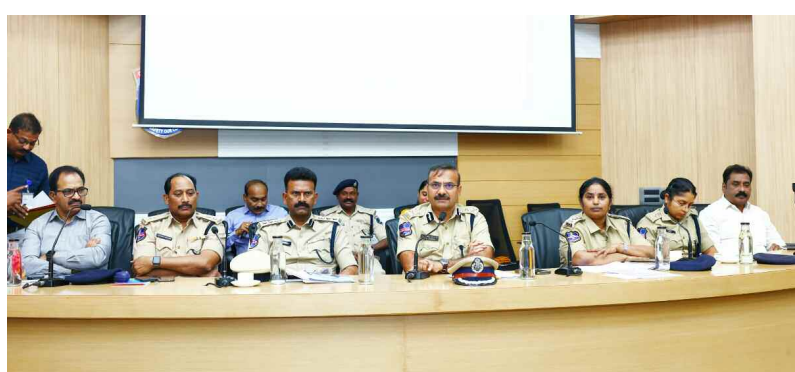
సైబరాబాద్ పోలీస్ కోవరేజీస్ క్లెరిక్ సహాయక మార్కెట్లకు సీపీ ఇతర అధికారులు