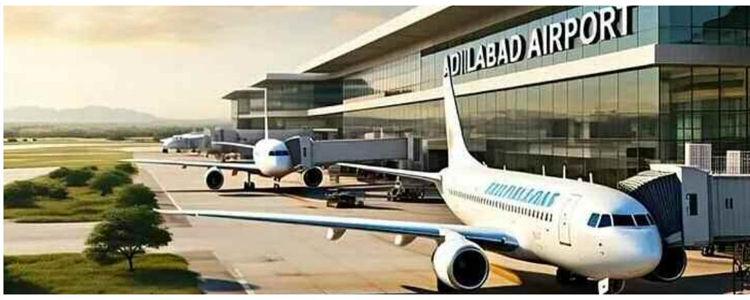
విధంగా చర్చలు చేపడుతున్నాం. గిరిజనులు ఎక్కువగా ఉండే ప్రాంతమైన ఆదిలాబాద్ లో సూతనంగా ఎయిర్ పోర్టు ఏర్పాటు చేయాలనేది చిరకాలంగా ఉన్న డిమాండ్. ఆదిలాబాద్ లో పెద్ద ఎయిర్ పోర్టును నిర్మించాలని నిర్ణయం తీసుకున్నాం. విమానాశ్రయాలపై వస్తున్న అన్ని డిమాండ్లను పరిశీలిస్తున్నాం. ఫీజుబిలిటీ ఉన్న చోట ఎయిర్ పోర్టులు నిర్మించేందుకు సిద్ధంగా ఉన్నాం." - రామ్మోహన్ నాయుడు, కేంద్రమంత్రి

ఉన్నామని వెల్లడించారు. అలాగే ఆదిలాబాద్, కొత్తగూడెం ఎయిర్ పోర్టు ప్రతిపాదనలను కూడా పరిశీలిస్తున్నామన్నారు. ఆదిలాబాద్ లో పెద్ద ఎయిర్ పోర్టు నిర్మాణం : ఆదిలాబాద్ లో సైనిక, పౌరుల అవసరాలకు అనుగుణంగా పెద్ద ఎయిర్ పోర్టు నిర్మించాలని కేంద్రం భావిస్తోందని రామ్మోహన్ నాయుడు తెలిపారు. ఇక్కడ సైన్యానికి శిక్షణతో పాటు సివిల్ ఎవియేషన్ అవసరాల కోసం వాడాలని రక్షణశాఖ మంత్రి చెప్పినట్లు గుర్తుచేశారు. ఈనెల 17న ఆదిలాబాద్ భూముల పరిశీలనకు అధికారులు వెళ్లారని, రక్షణశాఖ అధికారులు క్షేత్రస్థాయి పరిశీలన చేశాక తుది నిర్ణయం తీసుకుంటామని రామ్మోహన్ నాయుడు వివరించారు. ఇక్కడ రక్షణశాఖకు చెందిన 360 ఎకరాల భూమి ఉందని, రాష్ట్రభుక్తి 450 ఎకరాలు ఇవ్వాలి ఉంటుందని తెలిపారు. "అంతోకాలం నుంచి కేవలం ఒక ఎయిర్ ఫ్రీమ్ గా ఉండిపోయిన పరంగల్ లోని మామునూరు ఎయిర్ పోర్టు కోసం రాష్ట్ర ప్రభుత్వం సహకరించి భూమిని అప్పగించింది. ఎయిర్ పోర్ట్ ఆధారిత ఆఫీ ఇండియా తరఫున నిర్ణయం తీసుకుని ఒక మంచి ఎయిర్ పోర్టును నిర్మించాలని అడుగులు వేస్తున్నాం. మరో మూడు నెలల్లో దానికి శంకుస్థాపన చేసే