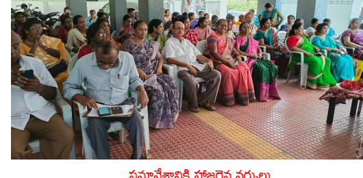
సమావేశానికి హాజరైన నర్సులు