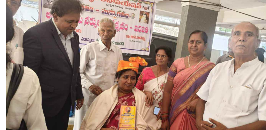
నర్సులను సన్మానిస్తున్న నిర్వహకులు

ఘనంగా అంతర్జాతీయ నర్సుల దినోత్సవం. 80 మంది నర్సులకు 'ఫోకెరెన్స్ వైటింగేల్' పురస్కారాలు కనిపించే దేవుళ్లు వైద్యులైతే.. కాపాడే దేవతలు నర్సులే ప్రముఖుల ప్రశంసలు శేరిలింగంపల్లి, మే 12, (నమస్తే ఉదయం)