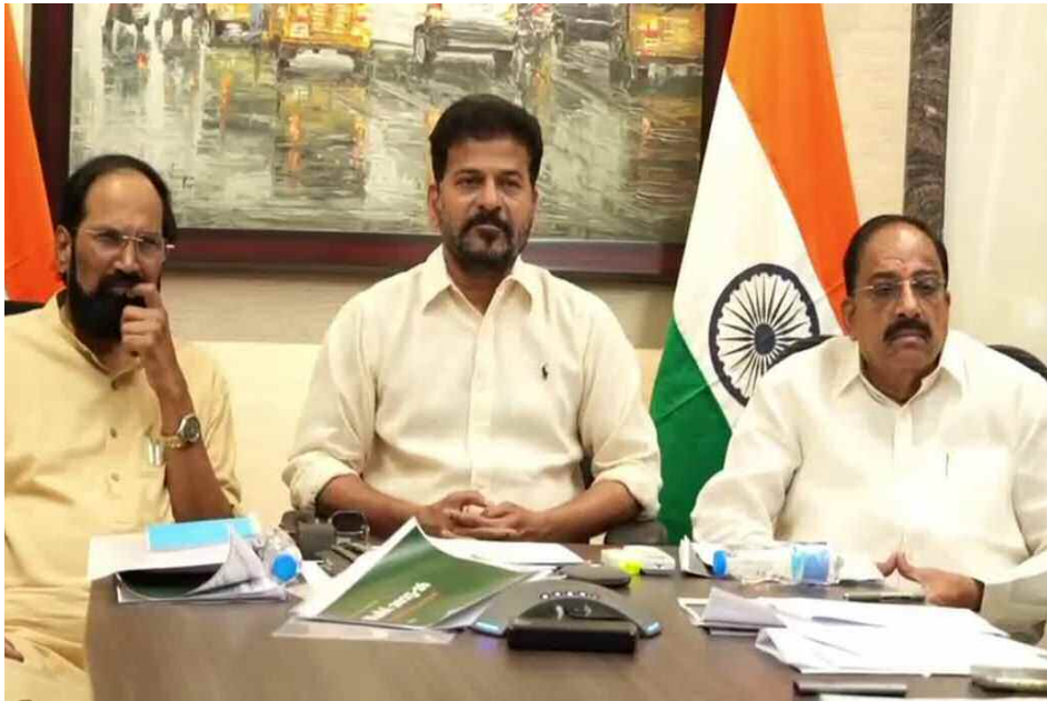
హైదరాబాద్, మే 12 (నమస్తే ఉదయం)

ధాన్యం, మొక్కజొన్న కొనుగోళ్లపై సమీక్షలో సీఎం రేవంత్ రెడ్డి