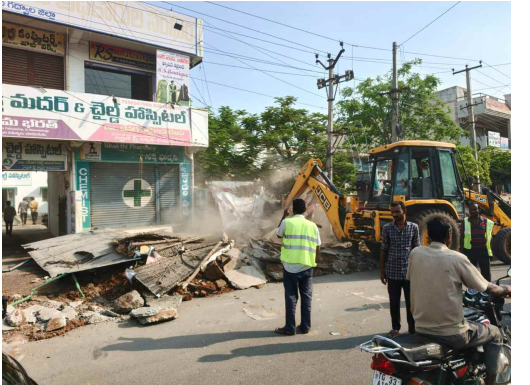
పెద్ద పెద్ద బిల్డింగ్ లను గాలికొద్దిచేసిన అధికారులు గవ్వాల జిల్లా ప్రతినధి,మే12(నమస్తే ఉదయం)