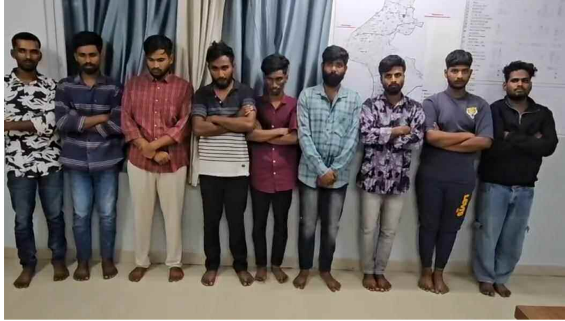
పోలీసులు అరెస్ట్ చేసిన యువకులు