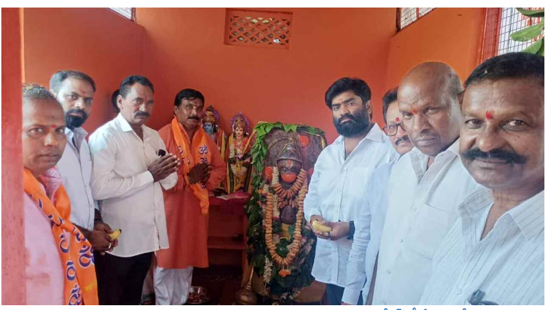
బుద్వేల్, మే 12 (నమస్తే ఉదయం)

బుద్వేల్ గ్రీన్ సిటీ పరిసర కాలనీలలో గల శ్రీ అంజనేయ స్వామి దేవాలయాలలో మంగళవారం బీజేపీ