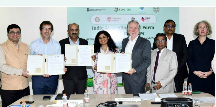
అవగాహన ఒప్పందం కార్యక్రమంలో పాల్గొన్న వ్యవసాయ విశ్వవిద్యాలయం అధికారులు, ఆస్ట్రేలియా ప్రతినిధులు