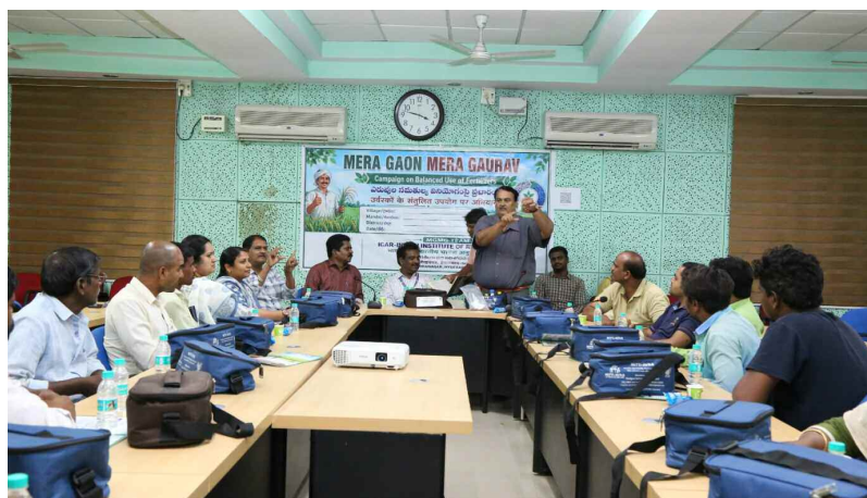
భారతీయ వరి పరిశోధన సంస్థలో నేల పరీక్షలు అవగాహన కార్యక్రమంలో పాల్గొన్న రైతులు