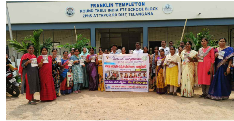
బడి బాట లో పాల్గొన్న ఉపాధ్యాయులు