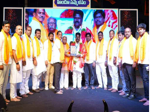
హిందూ సమ్మేళనం లో పాల్గొన్న ప్రజలు