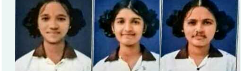
యెన్.కె.నవ్వు 540/600 అకులపెట్టి ఆఖల 530/600 గునలో వైశా 527/600