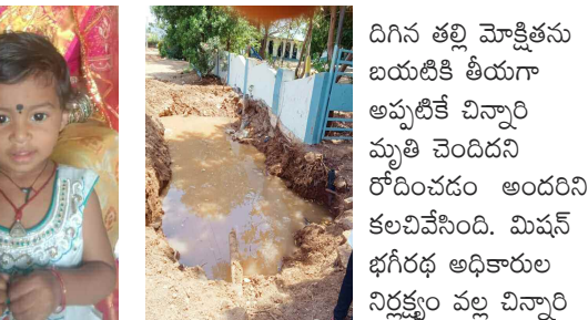
చిన్నారు మృత దేహంతో గ్రామస్థుల ఆందోళన