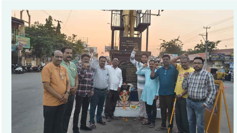
శ్రీ శ్రీ ఫోటో కు నివాళులు అర్పిస్తున్న కవులు, కళాకారులు