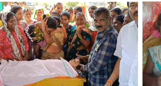
చిన్నారు మృత దేహంతో గ్రామస్థుల ఆందోళన

జనగామ జిల్లా బచ్చన్నపేట మండలం అలింపూర్ గ్రామంలోని ప్రభుత్వ ప్రాథమికోన్నత పాఠశాల ఆవరణ ప్రధాన గేటు ముందు మిషన్ భగీరథ పైప్ లీక్ అవుతుంది మరమ్మతుల కోసం 20 రోజుల క్రితం నాలుగు మీటర్ల గుంత అధికారులు తవ్వే ఉంచారని ఆధికారుల నిర్లక్ష్యంతో అభం శుభం తెలియని ఆడుకుంటూ వెళ్లి మృతి చెందగా అదే స్థలంలో గ్రామస్థులు ఆ చిన్నారు మృతదేహంతో గురువారం ఆందోళన చేశారు. స్థానికులు, బాధితులు తెలిపిన వివరాల ప్రకారం.. అలింపూర్ గ్రామంలోని ప్రభుత్వ ప్రాథమికోన్నత పాఠశాల ఆవరణ ప్రధాన గేటు ముందు మిషన్ భగీరథ పైప్ లీక్ అవుతుంది