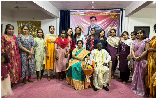
పాస్టర్ గారి కుటుంబంతో యువనస్థులు