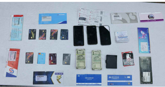
నిందితుల నుండి స్వాధీనం చేసుకున్న నగదు ఇతర పరికరాలు..