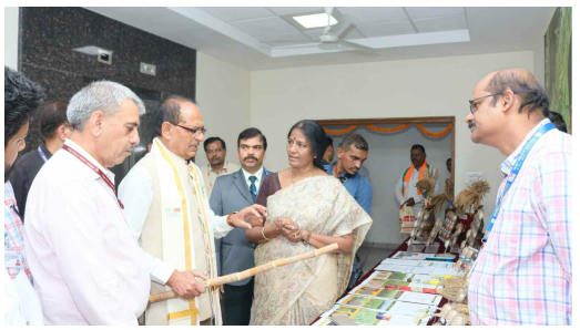
రాజేంద్రనగర్ లోని జాతీయ చిరు ధాన్యాల పరిశోధన సంస్థ లో జరుగుతున్న పరిశోధనలను పరిశీలిస్తున్న కేంద్ర వ్యవసాయ శాఖ మంత్రి శివరాజ్ సింగ్ చౌహాన్

పోషకాహార భద్రత, సుస్థిర వ్యవసాయం, వాతావరణ మార్పులను తట్టుకునే సామర్థ్యం, రైతు వర్గాల జీవనోపాధిని మెరుగుపరచడంలో చిరుధాన్యాల కీలక బిపాత్ర పోషిస్తాయని కేంద్ర వ్యవసాయ, రైతు సంక్షేమ, గ్రామీణాభివృద్ధి శాఖ మంత్రి శివరాజ్ సింగ్ చౌహాన్ అన్నారు. రాజేంద్రనగర్ లోని జాతీయ చిరుధాన్యాల పరిశోధన సంస్థ (ఐఐఎఐఆర్) లో నిర్మాణంలో ఉన్న గ్లోబల్ సెంటర్ ఆఫ్ ఎక్స్టెన్షన్ ఆన్ మిలెట్రీ (శ్రీ అన్న) భవనాన్ని గురువారం ఆయన సందర్శించారు. చిరుధాన్యాల ఉత్పత్తులు, మార్కెటింగ్, కంపెనీల ప్రతినిధులను ఆయన ఉత్తేజపరిచారు. ఈ సందర్భంగా ఆయన మాట్లాడుతూ, చిరుధాన్యాల వినియోగాన్ని విస్తరించడం, ప్రాసెసింగ్, విలువ జోడింపు మౌళిక సదుపాయాలను బలోపేతం చేయడం, చిరుధాన్యాల ఆధారిత వ్యాపారాలలో రైతు ఉత్పత్తిదారుల సంస్థలు, స్టాప్లు, మహిళా పారిశ్రామిక వేత్తలు, గ్రామీణ యువతకు మరిన్ని అవకాశాలు కల్పించడం కోసం కృషి చేయాలన్నారు. రైతుల