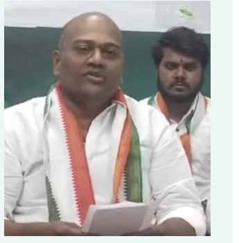
కూకట్ పల్లి, మే 23 (నమస్తే ఉదయం)