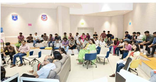
సమావేశానికి హాజరైన బి.టి. ఉద్యోగులు

నుండి వచ్చిన 20 ఫిర్యాదులను స్వీకరించి తక్షణ చర్యలు చేపట్టినట్లు వివరించారు. యాంటీ హ్యూమన్ ట్రాఫికింగ్ యూనిట్ ఒక టీబి కేసులో ఒక నిందితుడిని అరెస్ట్ చేసి, ఒక బాధితురాలిని రక్షించింది. అలాగే జేజీ యాక్ట్ కింద ఇద్దరు మైనర్ బాలరను రక్షించి ఇద్దరు నిందితులను కలకట్టాల్లోకి నెట్టామన్నారు. భార్యభర్తల మధ్య మనస్సుల కారణంగా చెదిరిపోయిన సంసారాల్లో ఫ్యామిలీ కౌన్సిలింగ్ సెంటర్లు సత్ఫలితాలను ఇచ్చాయి. కౌన్సిలర్ చొరవతో 35 కుటుంబాలు తిరిగి ఒకటయ్యాయని డి.సి.సి తెలిపారు. 2,378 మందికి విస్తృత నేరాలను అరికట్టేందుకు అవగాహన కల్పించడం జరిగిందన్నారు. బాలల అక్రమ రవాణా, ఈవ్