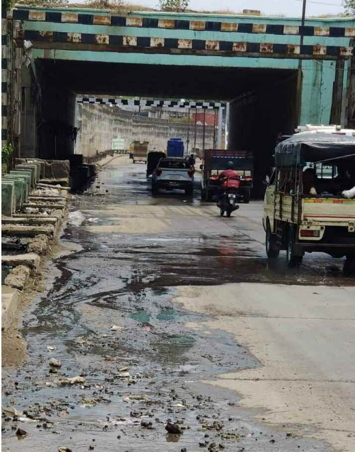
పాత కర్నూల్ రోడ్డు లో గల రైల్వే అండర్ పాస్ లో ప్రవహిస్తున్న మురుగు నీరు

గగన్ పహాడ్ పాత కర్నూల్ రోడ్డు నుంచి కాటేడాన్ వైపు వెళ్లే మార్గంలో ఉన్న రైల్వే అండర్ పాస్ లోకి మురుగునీరు తో పాటు, కాలుష్య వ్యర్థ జలాలు వస్తుండటంతో ఆ మార్గంలో వాహనాలపై వెళ్లే వారికి, నడుచుకుంటు వెళ్లే వారికి అసౌకర్యంగా ఉంటుంది. గగన్ పహాడ్ నుంచి కాటేడాన్ వెళ్లాలన్నా, కాటేడాన్ నుంచి గగన్ పహాడ్ రావాలన్నా ఇదే దారి గుండా రావాల్సి ఉంటుంది. ఈ అండర్ పాస్ లోకి పై నుంచి మురుగునీరు ప్రవహిస్తుండటంతో వాహనదారులు తీవ్ర ఇబ్బందులు పడుతున్నారు. వాహనాలపై వెళ్తున్న సమయంలో మురుగునీరు బట్టలపై పడుతుం దని వాపోతున్నారు.