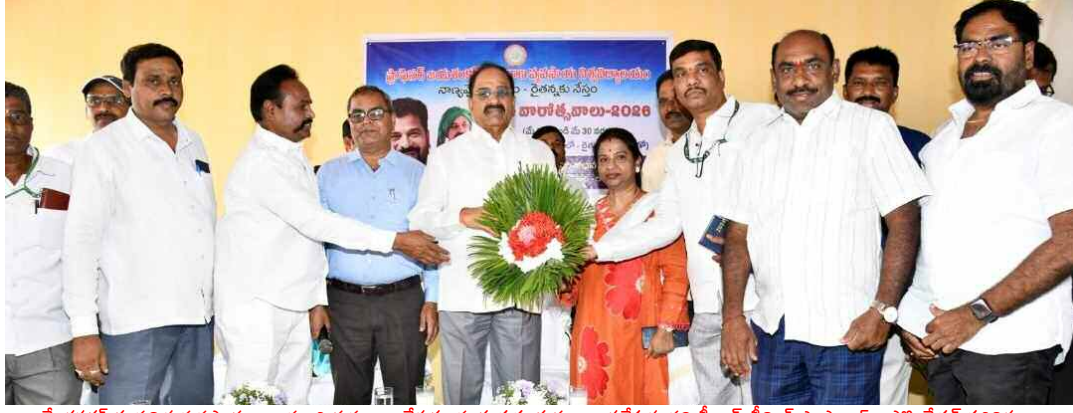
రాజేంద్రనగర్ కు విత్తన వ్యవసాయ శాఖ మంత్రి తుమ్మల నాగేశ్వర్ రావు కు పుష్ప గుచ్ఛం అందచేస్తున్న పబ్లిటీ వాన్ డివిజన్ ఎంపిఐఎస్ ఆఫీసు యేషన్ ప్రతినిధులు

నాణ్యమైన విత్తనాన్ని రైతుకు అందజేసి వారు స్థిరమైన ఆదాయాన్ని పొందే విధంగా శాస్త్రవేత్తలు కృషి చేస్తున్నారని, వారందరికీ ధన్యవాదాలు తెలియజేసు న్నానని తెలంగాణ రాష్ట్ర వ్యవసాయ శాఖ మంత్రి తుమ్మల నాగేశ్వర్ రావు అన్నారు. ప్రాఫెసర్ జయశంకర్ తెలంగాణ వ్యవసాయ విశ్వవిద్యాలయం ఆధ్వర్యంలో రాజేంద్రనగర్ లోని వ్యవసాయ పరిశోధన స్థానం (ఎఐఆర్) క్యాంపస్ లో శనివారం నిర్వహించిన విత్తన మేళా ను మంత్రి తుమ్మల నాగేశ్వర్ రావు ప్రారంభించి ముందుగానే బుక్ చేసుకున్న రైతులకు విత్తనాలను పంపిణీ చేశారు. ఈ సందర్భంగా ఆయన మాట్లాడుతూ, తెలంగాణ రాష్ట్ర వ్యాప్తంగా శనివారం నుంచి ఈ నెల 30 వరకు 1200 టన్నుల విత్తనాలను రైతులకు అందజేయడం జరుగుతుందన్నారు. ఆదర్శ ఆభ్యుదయ రైతులకు నాణ్యమైన విత్తనాలను అందజేసి వారి ద్వారా ఆయా గ్రామాల రైతులకు విత్తనాలు ఇచ్చే కార్యక్రమం చేపడుతున్నామన్నారు. దొడ్డి దారిని విక్రయించే విత్తనాలను రైతులు తీసుకోవద్దన్నారు. ఆదర్శ రైతులు అభివృద్ధి చేస్తున్న విత్తనాలను తీసుకోవాలన్నారు. గడిచిన 60 సంవత్సరాలుగా వ్యవసాయ విశ్వవిద్యాలయం రైతులకు సేవలందిస్తుందన్నారు. మొదటగా స్థాపించిన వ్యవసాయ విశ్వవిద్యాలయాలలో రాజేంద్రనగర్ లోని వ్యవసాయ విశ్వవిద్యాలయం దేశంలోనే రెండవ విశ్వవిద్యాలయం అని గుర్తు చేశారు. తెగుళ్లు, కార్మికుల సమస్యలు ఉంటున్న ఈ సందర్భాల్లో డ్రోన్ ల ద్వారా పురుగుమందుల స్ప్రే చేయడం పై రైతులకు, మహిళా రైతులకు శిక్షణ ఇచ్చి డ్రోన్