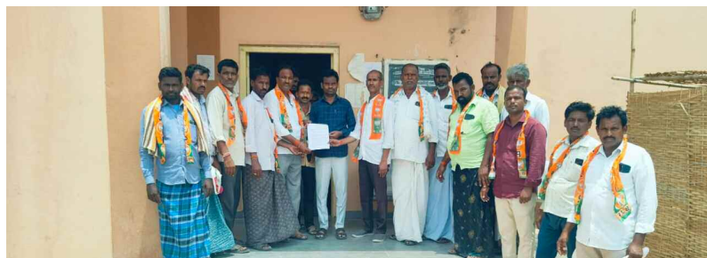
కొనుగోలు చేసిన ధాన్యాన్ని గోధాలకు తరలించాలి

గద్వాల జిల్లా ప్రతినధి, మే 23 (నమస్తే ఉదయం)