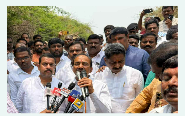
నిరుపేద ప్రజలకు ప్రభుత్వం ఇళ్ల స్థలాలు కేటాయించాలి