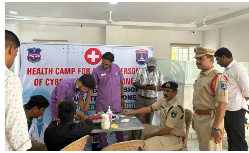
HEALTH CAMP FOR PERSONS OF CYBER SECURITY

టీజింగ్, సోషల్ మీడియా వేధింపులు, బాల్య వివాహాలు, చైల్డ్ లేబర్, స్టాకింగ్, సైబర్ బుల్లియం, సైబర్ ఫ్రాడ్స్ వంటి అంశాలపై ప్రజలను చైతన్య పరిచేందుకు పలు కార్యక్రమాలు నిర్వహించడం జరిగిందని తెలిపారు. ఆపరేషన్లలో మహిళా 181, చైల్డ్ హెల్ప్ లైన్ 1098, డయల్ 100, సైబర్ క్రిమ్ హెల్ప్ లైన్ 1930 నెంబర్ ప్రాధాన్యతను వివరించారు. కార్పొరేట్ ఉద్యోగుల భద్రత, మానసిక శ్రమిస్తే లక్ష్యంగా సాఫ్ట్ ఫర్ సైబరాబాద్ సెక్యూరిటీ కౌన్సిల్ అధ్యక్షులలో మే 19న హెచ్ఎస్సీలో క్యాంపస్ లో ప్రత్యేక సదస్సు నిర్వహించారు. ఈ కార్యక్రమానికి 150 మందికి పైగా ఉద్యోగులు హాజరయ్యారు. డి.సి.సి సృజన తెలిపారు.