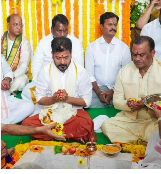
అందించనున్నారు. పలు అభివృద్ధి కార్యక్రమాలకు శంకుస్థాపన :

నుంచి హెలికాప్టర్ లో యాదగిరి గుట్టకు వెళ్లిన సీఎం ముందుగా కంచి కామకోటి పీఠాధిపతి విజయేంద్ర సరస్వతి స్వామి వారి ఆశీస్సులు తీసుకున్నారు. అనంతరం జగద్గురు పర్యవేక్షణలో వేదమంత్రోచ్ఛరణల నడుమ వేద పాఠశాలకు శాస్త్రోక్తంగా భూమిపూజ నిర్వహించారు. వేదపాఠశాలను రూ. 43 కోట్ల వ్యయంతో 15 ఎకరాల్లో నిర్మించనున్నారు. ఇందులో 300 మంది విద్యార్థులు వేద విద్యను అభ్యసించే విధంగా అందుబాటులోకి తీసుకురానున్నారు. వేద పాఠశాలలో విద్యార్థులకు ఉచిత భోధనతో పాటు ఉచిత వసతి, భోజన సౌకర్యాలు కల్పించనున్నారు. అత్యాధునిక గోశాలతో పాటు యజ్ఞశాల, యాగశాలలు సైతం నిర్మించనున్నారు. ప్రభుత్వం ప్రతిష్ఠాత్మకంగా ఏర్పాటు చేస్తున్న వేదపాఠశాలలో కంచి కామకోటి పీఠం పర్యవేక్షణలో భోధన చేపట్టనున్నారు. రుగ్మీదం, యజుర్వేదం, సామవేదం, అధర్వణ వేదంతోపాటు ఆగమ శాస్త్రాన్ని అధ్యయనం చేసేందుకు వీలు కల్పించి విద్యార్థులకు పట్టాలు