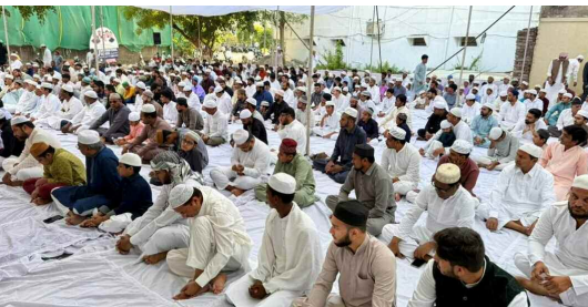
ప్రార్థనలో పాల్గొన్న ముస్లిం సోదరులు