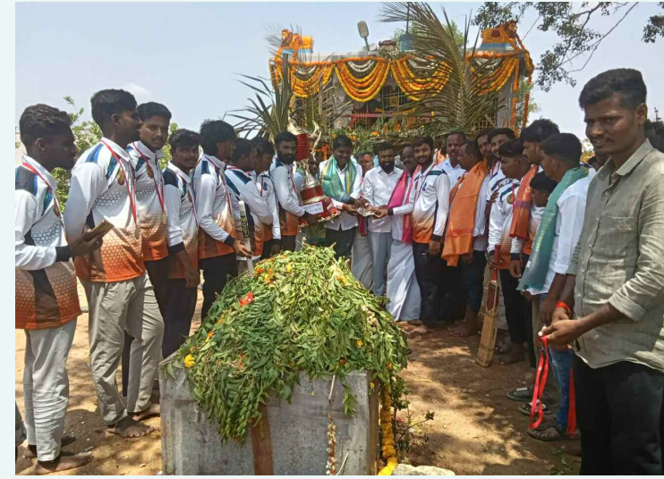
మొదటి బహుమతి బిజేత ఆర్.ఆర్.అర్ జిల్లా