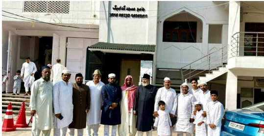
జన వైతన్య కాలనీ జామా మసీదు ఘరాణీగ వద్ద ముస్లిం సోదరులు