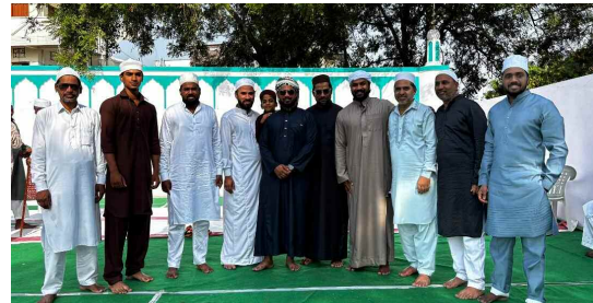
ప్రేమావతి పేజీ మసీదు వద్ద ముస్లిం సోదరులు