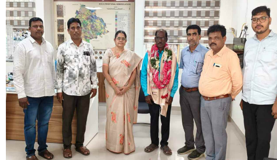
నర్సింగ్ రావు సు సహకార వ్యవస్థ అధికారులు