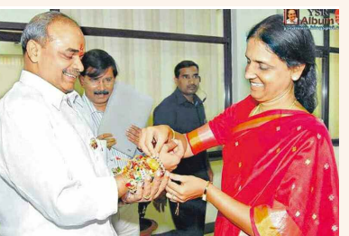
రాష్ట్ర హోంశాఖ మంత్రిగా.....

2004 లో రాష్ట్ర మంత్రి గా బాధ్యతలు చేపట్టిన సబితా ఇంద్రారెడ్డి పాలనపై పట్టు సాధించారు. తన గెలిచిన చేవెళ్ల, మహిళా నియోజకవర్గంతో పాటు రంగారాజు జిల్లా మొత్తం వేల కోట్ల నిధులతో అభివృద్ధి చేశారు. ప్రధానంగా మొదటి ప్రాతినిధ్యం వహించిన చేవెళ్ల నియోజకవర్గం ను ముందు చూపుతో అభివృద్ధి చేశారు. నియోజకవర్గం లోని రాజేంద్రనగర్, శంషాబాద్ మండలాల పట్టణాలు గా మారి జూబ్లీహిల్స్, బంజారా హిల్స్, హైటెక్ సిటీ లతో సమానంగా పోటీ పడుతున్నాయంటే ఈ ప్రాంతాలలో సబితా రెడ్డి అప్పుడు నాటిని తలదన్ను తున్నారు. ప్రధానంగా రాజీవ్ గాంధీ అంతర్జాతీయ విమానశ్రయం, పి ఎన్ ఆర్ పై ఓవర్, ఔటర్ రింగ్ రోడ్లు, అందర్ గ్రౌండ్ డ్రైనేజీ, ఇలా ముందు చూపుతో ఈ ప్రాంతాని అభివృద్ధి చేసిన ఘనత మాజీ మంత్రి సబితా ఇంద్రారెడ్డి కె దక్కకుండా.