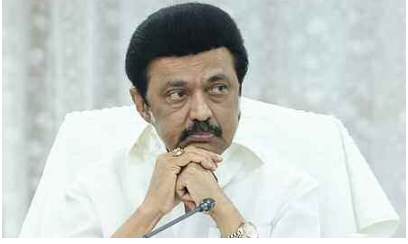
తమిళనాడు సీఎం 2లో.. స్టాలిన్ ఓటమి