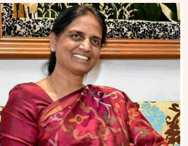
భాగంగా ప్రపంచం తో పోటీ పడేలా

డి.ఆర్.ఎస్ హయాంలో ఏర్పడిన కె సి ఆర్ ప్రభుత్వం లో సబితా ఇంద్రారెడ్డి 2019 నుంచి 2023 వరకు రాష్ట్ర విద్యా శాఖ మంత్రి గా పనిచేశారు. తనకు వచ్చిన అపార అనుభవంతో విద్యా శాఖ లో ప్రక్షాళన చేశారు. ప్రధానంగా మన ఊరు... మన భవిష్యత్తును చేపట్టి గ్రామ గ్రామాన ప్రతి బాలురు చదువుకునేలా చేశారు. రాష్ట్రంలో దాదాపుగా పున్నా 9000 ప్రభుత్వ పాఠశాలలో వేలాది కోట్లతో అధునికీకరణ పనులు చేపట్టారు. దిన దినానికి పెరుగుతున్న ఆదినికరణలో