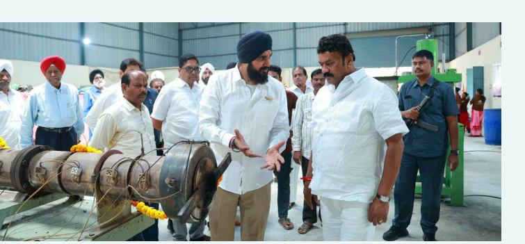
ప్లాస్టిక్ వ్యర్థాల నుంచి బైట్స్, ఇటుకల తయారీ పరిశ్రమ ను ప్రారంభించి పరిశోధన, పాకీ మంత్రి తలసాని శ్రీనివాస్ యాదవ్