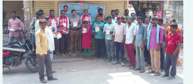
చింతల్ మెట్ లేబర్ అడ్వా వర్గ కార్మికులకు సంక్షేమ కార్డుల వల్ల కలిగే లాభాలను వివరిస్తున్న కార్మిక శాఖ అధికారులు