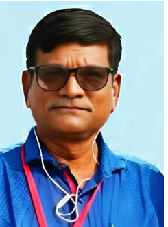
సుంకర రామ్మోహన్ రావు

భవన నిర్మాణ రంగంలో పాటు ఇతర నిర్మాణ రంగంలో పనిచేసే బిన్ను ప్రతి ఒక్కరు కార్మికశాఖ అందజేసే గుర్తింపు కార్డును పొందడం ద్వారా ప్రభుత్వం ద్వారా అందజేసే సంక్షేమ పథకాలకు అర్హులౌతారని కన్ ప్రెక్షన్ వర్క్స్ ఫెడరేషన్ ఆఫ్ ఇండియా (సీడబ్ల్యుఎఫ్ఐఎ) జాతీయ ఉపాధ్యక్షులు సుంకర రామ్మోహన్ రావు తెలిపారు. 2025 నవంబరు నుంచి తెలంగాణ రాష్ట్ర ప్రభుత్వం, కార్మికశాఖ ఆధ్వర్యంలో కార్డు దారులకు మేలు చేసే విధంగా పథకాలను చేపట్టిందన్నారు. ఇదంతా తమ సంఘం తో పాటు ఇతర కార్మిక సంఘాలు చేసిన పోరాట ఫలితమే అని గుర్తు చేశారు. కార్మికులుగా పనిచేస్తున్న ప్రతి ఒక్కరు తమ ఆధార్, ఫోటోలు పెట్టి కార్మికశాఖ అందజేసే గుర్తింపు కార్డు ను తీసుకోవాలన్నారు. కార్డు ఉన్న మహిళ ప్రపంచ సమయంలో ప్రసూతి కాసుకగా రూ. 30వేలు, వారి పిల్లల వివాహ సమయంలో రూ.30 వేలు కాసుకగా అందజేయడం జరుగుతుందన్నారు. కార్డు ఉన్న కార్మికులు గతంలో సహజ మరణం పొందితే వారి కుటుంబ సభ్యులకు ఒక లక్ష రూపాయలు ఇచ్చేవారని, నేడు దానిని రెండు లక్షలకు పెంచడం జరిగిందన్నారు. కార్మికుడు ప్రమాదవశాత్తు మరణిస్తే గతంలో రూ. 6లక్షలు ఇచ్చేవారని, నేడు దానిని రూ.10 లక్షలకు పెంచడం జరిగిందన్నారు. ప్రమాదవశాత్తు శాశ్వత అంగవైకల్యం కలిగితే రూ. 5లక్షలు, పాక్షికంగా అంగవైకల్యం కలిగితే రూ. 4లక్షలు ఇవ్వడం జరుగుతుందన్నారు. ఈ నేపథ్యంలో ప్రతి కార్మికుడు తప్పనిసరిగా కార్మికశాఖ అందజేసే గుర్తింపు కార్డులను తీసుకుని ప్రభుత్వం అందజేసే పథకాలను సద్వినియోగం చేసుకోవాలన్నారు.