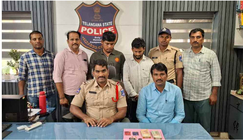
వివరాలను వెల్లడిస్తున్న పోలీసులు