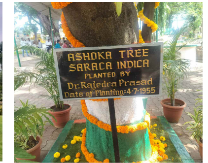
భారత తొలి రాష్ట్రపతి డాక్టర్ రాజేంద్ర ప్రసాద్ నాదీన అశోక వృక్షం

హెచ్ఎండిఏ అధికారుల సహకారంతో గార్డెన్ల పునరుద్ధరణ