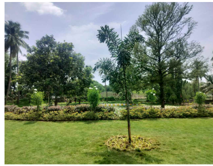
అభినందనమైన వాతావరణంలో పచ్చి బయళ్లు