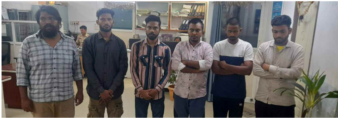
పోలీసులు అరెస్ట్ చేసిన నిందితులు

నిందితులను లిమాండ్కు తరలించిన అత్యాచార పోలీసులు బుద్వేల్, జూన్ 13 (నమస్తే ఉదయం):