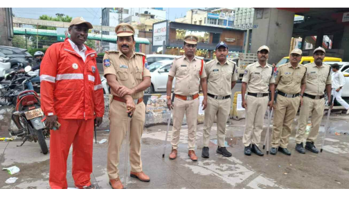
చర్యలు చేపట్టారు. కూకట్ పల్లి పోలీస్ స్టేషన్ పరిధిలో లా అండ్ ఆర్డర్ విభాగం, ట్రాఫిక్ విభాగం అధికారులు సంయుక్తంగా ట్రాఫిక్ క్లియరెన్స్ ఆపరేషన్లు

నిర్వహిస్తున్నారు. ప్రధాన రహదారులు, రద్దీ కూడళ్ల వద్ద ప్రత్యేక బృందాలను మోహరించి వాహనాల రాకపోకలను క్రమబద్ధీకరిస్తున్నారు. వర్షాల కారణంగా ఏర్పడే ట్రాఫిక్ అంతరాయాలను తగ్గించి, ప్రజలకు ఎలాంటి ఇబ్బందులు కలగకుండా చర్యలు తీసుకుంటున్నట్లు అధికారులు తెలిపారు. ప్రజలు అత్యవసరమైతేనే బయటకు రావాలని, వాహనదారులు ట్రాఫిక్ నియమాలను పాటించి పోలీసులకు సహకరించాలని కూకట్ పల్లి పోలీస్ స్టేషన్ హౌస్ ఆఫీసర్ (ఎస్సెచ్) సూచించారు. వర్షాల సమయంలో ప్రజల భద్రతకు అత్యంత ప్రాధాన్యత ఇస్తూ పరిస్థితులను నిరంతరం పర్యవేక్షిస్తున్నామని ఆయన పేర్కొన్నారు.