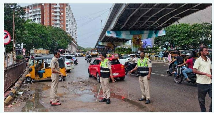
వర్షం వరుగుతున్న వేదికపై ఎవరు వర్ష విధులు నిర్వహిస్తున్నారో ట్రాఫిక్ లా అండ్ ఆర్డర్ పోలీసులు...