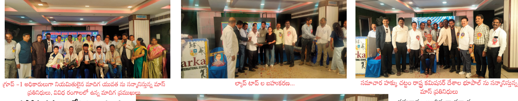
గ్రూప్ -1 అధికారులుగా నియమితులైన మందిగ యువత ను సన్మానిస్తున్న మాస్ ప్రతినిధులు, వివేక రంగాలలో ఉన్న మాదిగ ప్రముఖులు