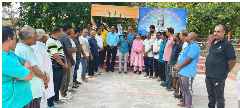
హెల్త్ లైన్ 14416.. 24 గంటలు సేవలు..