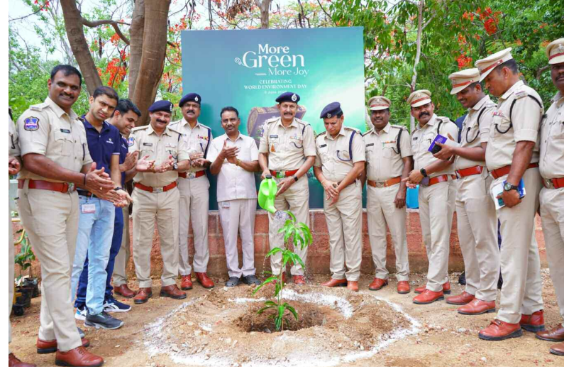
ప్రపంచ పర్యావరణ దినోత్సవాన్ని పురస్కరించుకొని కొండాపూర్ 8వ బెటాలియన్ లో మొక్కలు నాటుతున్న కామాండెంట్ ఇతర అధికారులు